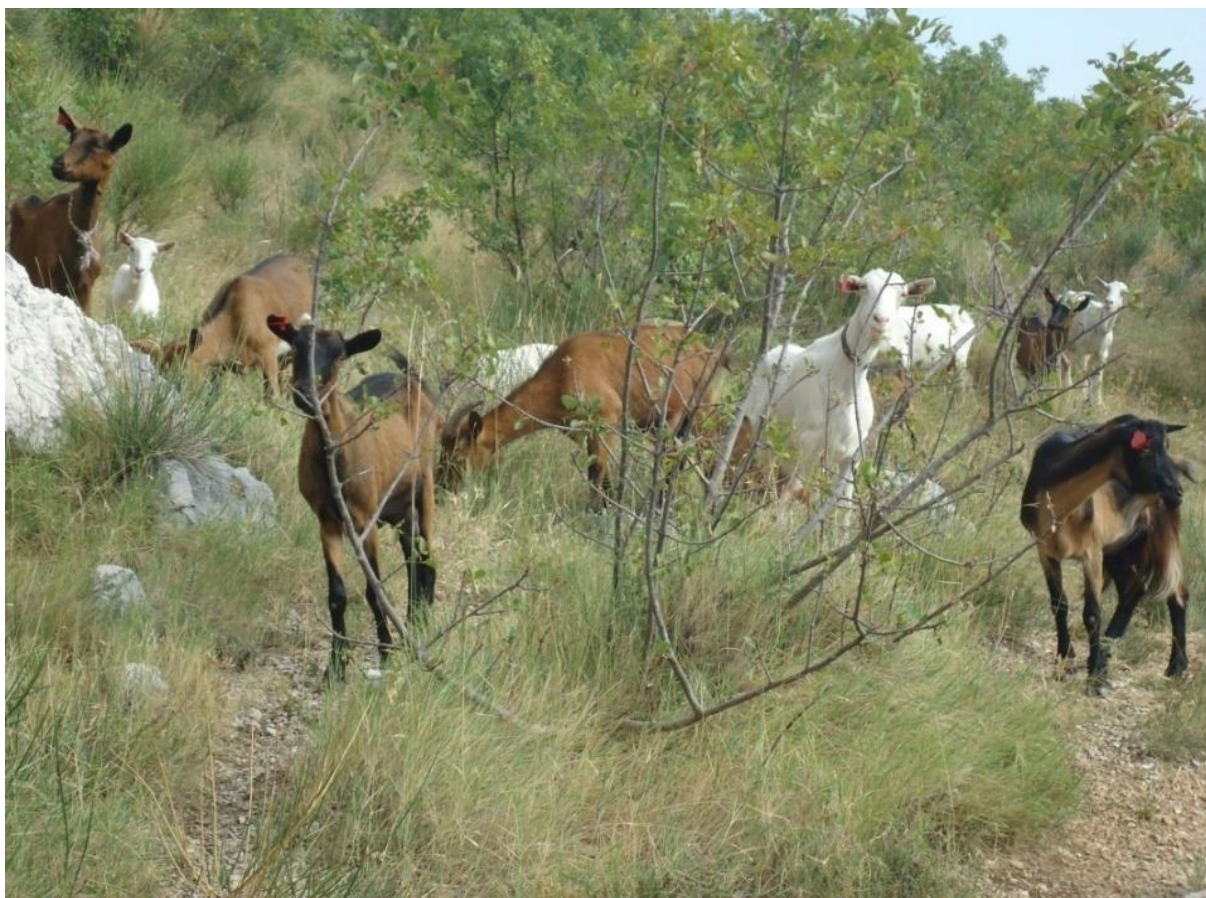
FOTOGRAFIJA 5: Kozjak .

Gajine, koje se nalaze u blizini, predstavljaju uvećanicu za gaj, šumu gdje se nalaze grobni nalazi, a to je područje zaštićeno dok se temeljitije ne ispita.