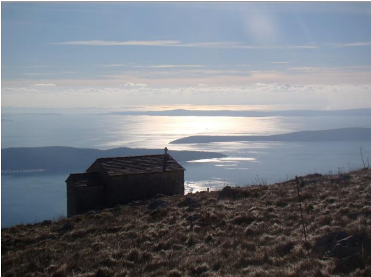
FOTOGRAFIJA 3: Crkvica sv. Luke .

Osim crkvice svetoga Jure, na Kozjaku se nalazi i crkvica sv. Luke, a prije je postojala i crkvica sv. Mihovila. Crkvica Sv. Luke srednjovjekovna je građevina iz 14. stoljeća na istaknutoj stijeni Kozjaka, kako spomen ploča kazuje „žuljevitim rukama naših pradjedova“. Obnovljena je 1994. godine kada je u apsidi postavljen reljef s likom sv. Luke.