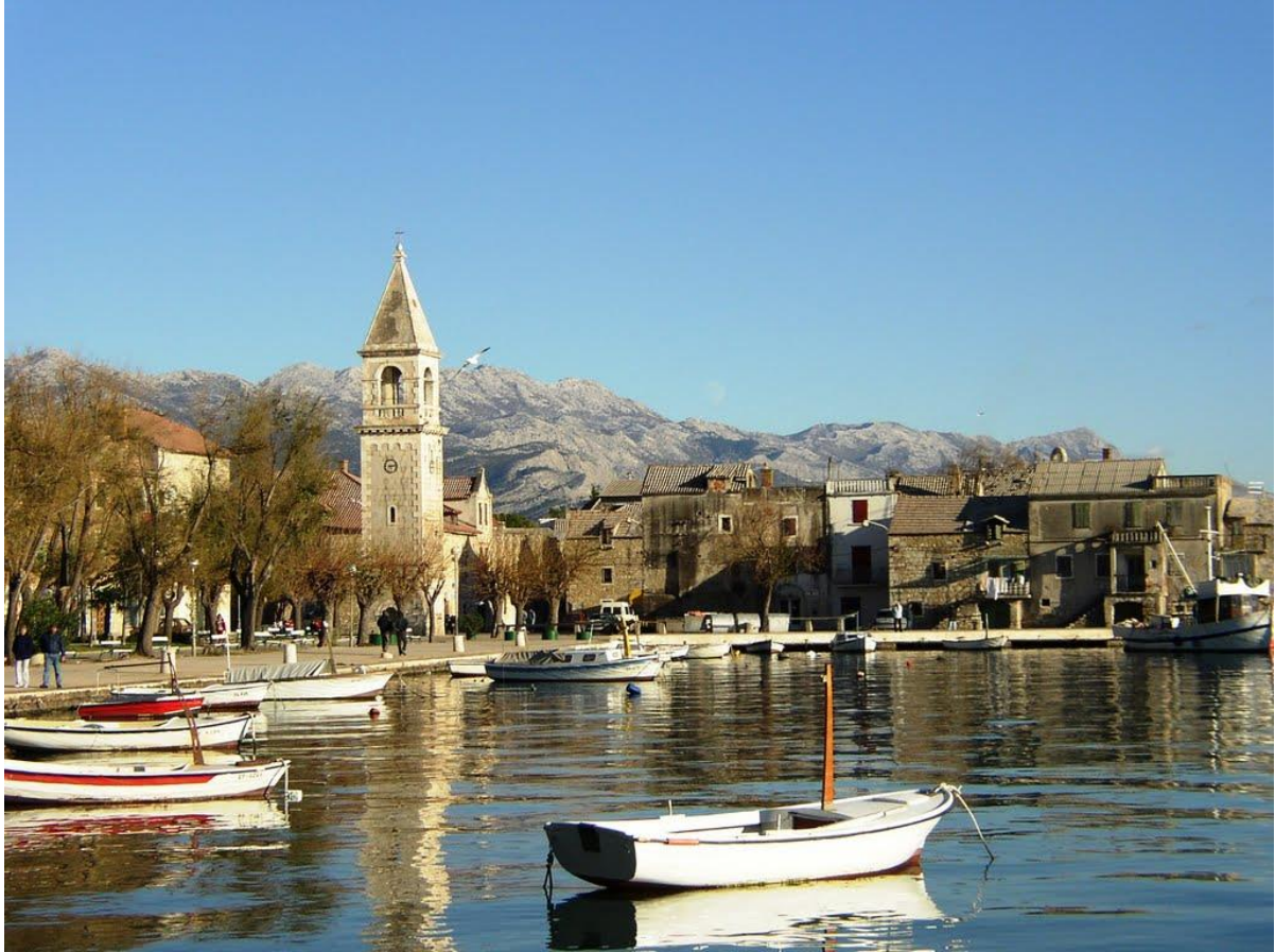
FOTOGRAFIJA 1: Kaštel Sućurac .