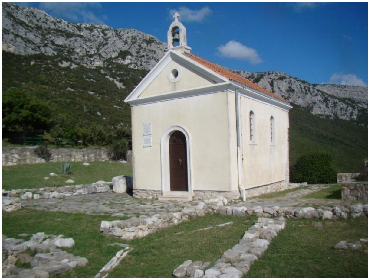
FOTOGRAFIJA 2: Crkvice sv. Jurja .

Evidentno je da štovanje svetoga Jurja (Jure) ima golem značaj za Sućurac. Njegovim se imenom naziva stara crkvice na Putlju, mjesna župa i škola, i na koncu samo mjesto kojega je ujedno i zaštitnik. Štoviše, oko toga se sveca ispreplela legenda u kojoj je sveti Juraj ubio zmaja. Crkva Sv. Jurja obnovljena je posljednji put 1927. godine, a izgrađena je na mjestu starohrvatske crkvice, za koju smo ranije spomenuli da ju je 839. godine dao sagraditi knez Mislav.