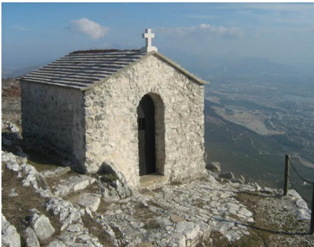
FOTOGRAFIJA 4: Crkvice sv. Luke.

U blizini potočića Plandišće, prema granici sa Solinom, smjestili su se Stačuni (od lat. stationem ) gdje se u rimsko doba nalazila postaja ( statio ), odmorište za zaprege što potvrđuje i tekst na karti sućuračkoga teritorija iz 1776., koji glasi vestitiga di antico aedificio detto Stacium , što znači da se lokalitet već davno tako nazivao, ali građevina koju je glasoviti hrvatski arheolog don Frane Bulić spomenuo sigurno nije bila zgrada postaje (Cambi U: Kaštel Sućurac od prapovijesti do XX. stoljeća 1992: 50). Moguće je stoga, da je ovaj prostor služio kao odmorište, odnosno mjesto za plandovanje (Delić: 1996: 39). Stačuni (Stačunine, Stačuline) jesu grobni areal, a ostaci su, izgleda, uništeni prigodom širenja pogona Brodospas. Blokovi i radovi zidova koje je snimio Bulić, jasno otkrivaju vezu i sličnost sa salonitanskim grobišnim konstrukcijama stationem . Bulić smatra da je taj dio statio bila prva postaja na