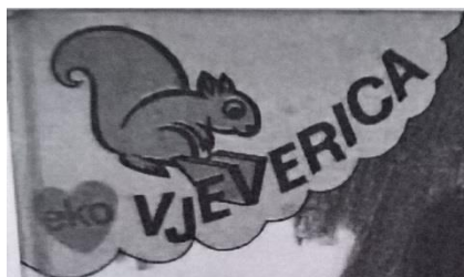
Slika br. 5: logo eko Vjeverice