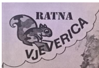
Slika br. 4: logo ratne Vjeverice