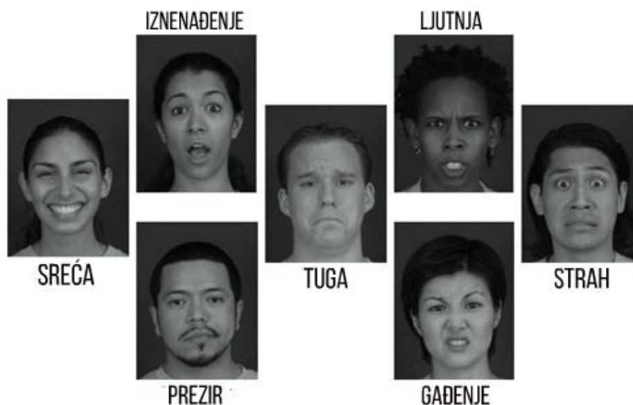
SLIKA 2: SEDAM OSNOVNIH EMOCIJA I NJIHOVIH EKSPRESIJA