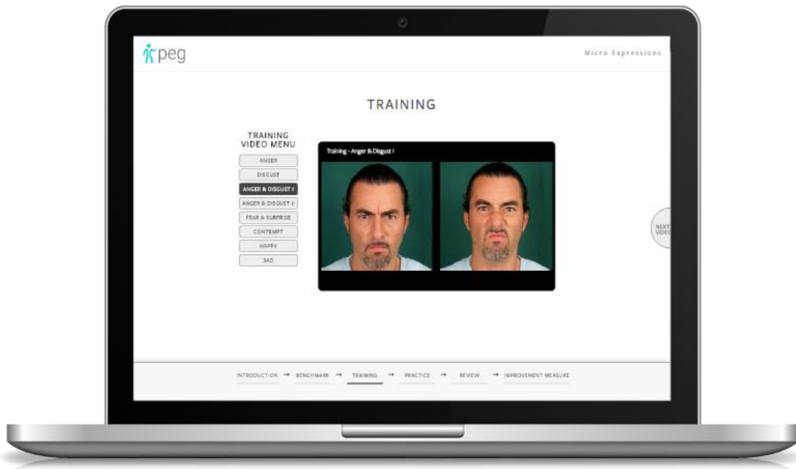
SLIKA 3: METT SUSTAV

Uvježbavanje uočavanja mikroekspresija provodi se pomoću takozvanog METT sustava (Micro Expression Training Tool), kojeg je Paul Ekman razvio i omogućio da većina ljudi već u prvih sat vremena uvježbavanja postigne točnost od 80 ili više posto (2009a: 351). Nakon što se trening prođe s dovoljno visokim postotkom uspješnosti, dobiva se certifikat koji to potvrđuje. Alat je prilagođen svima, a preporuča se za zanimanja koja imaju koristi od prepoznavanja laži, smirivanja ljudi s kojima rade i razumijevanja svog klijenta, poput sigurnosnih službi, medicine ili obrazovanja.