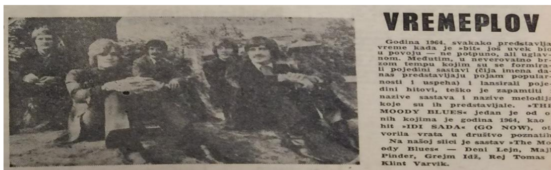
Slika 2. Rock glazba u Vremeplovu, Mladost, broj 633, listopad, 1968.

zblizavanja rock glazbe i vlasti, čime ona ide u smjeru da postane njezinom produženom rukom. Stoga, glazbena scena Jugoslavije, koja je tek u nastanku, uživati će jedinstvenu potporu od strane vlasti, a unatoč tome što rock glazbu ovog razdoblja definiramo kao apolitičku, ona će u nadolazećim godinama preuzeti sasvim nove uloge. 40