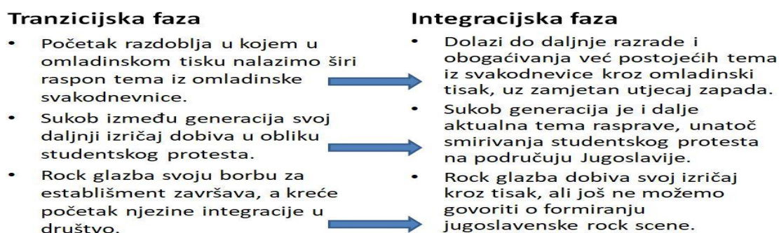
Slika 7. Prijelaz iz tranzicijske u integracijsku fazu

onaj neispunjenih obećanja i nedostatka osjetljivih promjena u društvu, koje možemo promatrati na način na koji se omladinski tisak dotiče teme samoupravljanja. On time ostaje aktualna tema rasprave, uz jedinu promjenu u činjenici da sada dolazi do pokušaja analize njegovih nedostataka i pogrešaka. Sve ovo stvarano je u cilju svojevrstne pomirbe s trenutnom društvenom situacijom. Paralelno promatramo sasvim specifičan odnos politike prema mladima. Dok govorimo o društvenoj liberalizaciji, na političkoj sceni ipak možemo jasno vidjeti ocrtanu granicu u odnosu prema mladima te rock glazbi. Jedan takav primjer nalazimo u gašenju časopisa Polet, Susret te sudskog procesa protiv Pop Expresa. Prva dva su na direktan način mogla iskusiti cenzuru unutar društva, čime dolazimo do zaključka da, unatoč govoru o liberalizaciji, komunistička partija ne popušta svoj stisak na mladež. No, ovaj potez ipak ne prolazi bez kritike, koja se izražava kroz reviju Susret, a pokazuje spremnost omladine da brani svoje kritičke stavove. Rock glazba jednako tako ostavlja dojam na političkoj sceni u ovome razdoblju, i to upravo kroz časopis Pop Ekspres. Završivši na sudu radi onoga što su nazivali teška povreda morala, ovdje se pokazao stvaran prag tolerancije politike prema rocku. Na kraju, odluka je donesena u korist optuženih, a politički vrh dobiva novo sredstvo, preko kojeg će nastojati utjecati na omladinu.