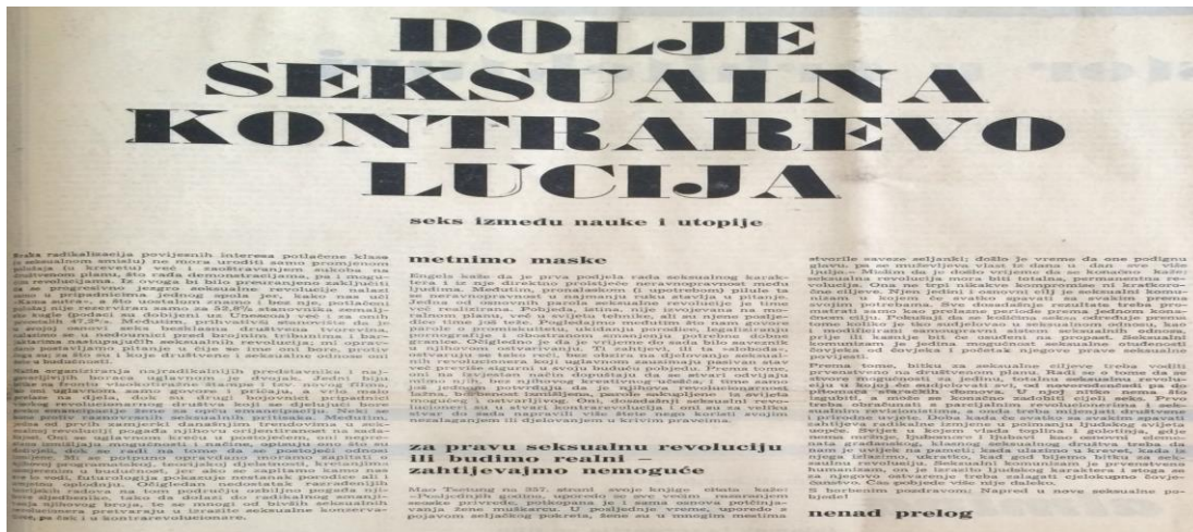
Slika 3. Dolje seksualna kontrarevolucija, Omladinski tjednik, broj 62.

Istovremeno, prvi put se spominje korištenje lakih droga kod omladine. Spomenuto će se u kasnijem razdoblju povezivati upravo uz rock glazbu, zbog koje će ista, nerijetko biti i tema kritike. U prvom redu, radi se o marihuani i LSD-u, a postoje i oni, koji spomenute opijate smatraju sredstvom oslobođenja od represije i depresije svakodnevice. 73 Riječima Iana Dury-a: „ Sex, drugs & rock'n'roll, it all that my body need! “. 74