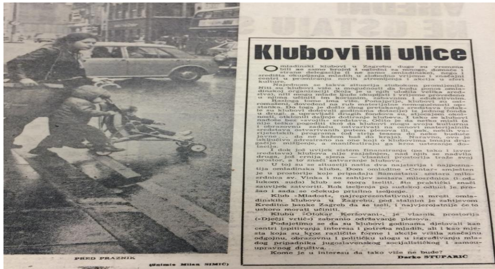
Slika 4. Klubovi ili ulice, Mladost, br. 736.

institucijskih i političkih kriterija te ekonomske nebrige, u čijem središtu nalazimo upravo omladince i njihove klubove. 91