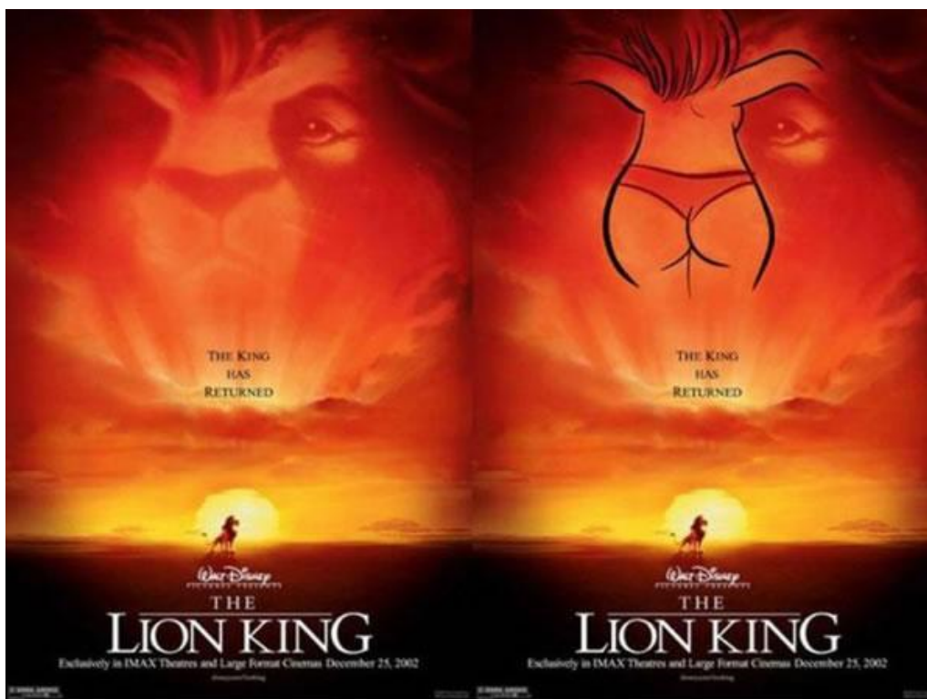
Slika 2. Originalni plakat za crtani film Kralj lavova iz 2002. godine (lijevo) i obris gole žene skrivene kao subliminalna poruka (desno)

Nikad nije jasno razjašnjeno vidi li ovdje „prljavi um“ ono što želi vidjeti ili je zaista korištena Keyjeva prva metoda ubacivanja subliminalnih poruka.