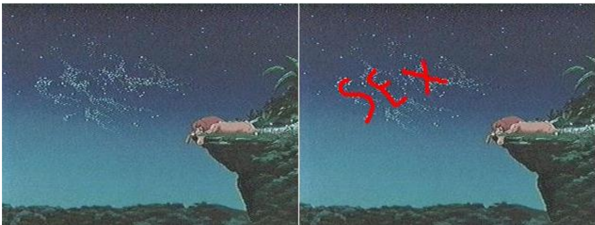
Slika 1. Isječak iz crtanog filma Kralj lavova (lijevo) i označeni dio gdje je ubačena subliminalna poruka „sex“ (desno)

prašine u jednom trenutku naprave oblik riječi „SEX“ (Mikkelson, 2015). Miliša (2013: 300) navodi kako su se takve poruke dugo ignorirale jer su se isprva doimale kao šala, no one u stvari imaju duboke implikacije. Tvorci filma kasnije su potvrdili kako tu uistinu postoji riječ samo što ona nije „SEX“ već „SFX“, kratica za „special effects“ (u prijevodu: specijalni efekti). Kraticu su u film, navodno, namjerno ubacili ljudi iz odjela za specijalne efekte (Mikkelson, 2015) te je ova verzija priče postala službena za one pojedince koji ne vjeruju u subliminalne poruke. Primjer ove subliminalne poruke vidljiv je na slici 1.