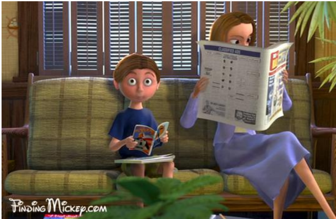
Slika 8. U ovoj sceni crtanog filma Potraga za Nemom dječak čita strip Izbavitelji