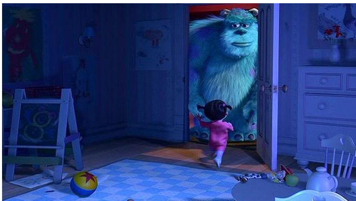
Slika 7. Jessie iz crtanog filma Priča o igračkama 2 u crtanom filmu Čudovišta iz ormara