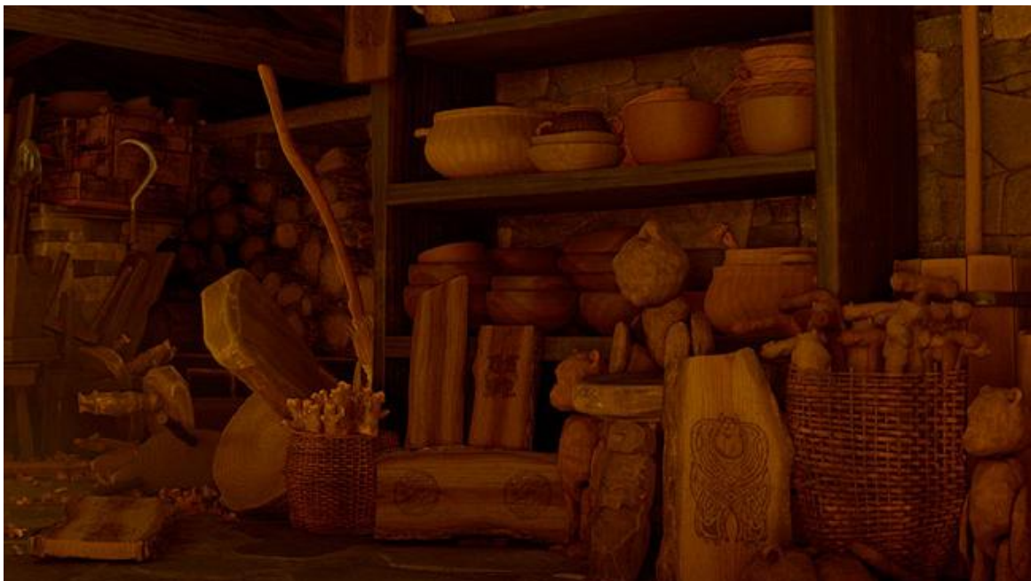
Slika 9. Sully iz crtanog filma Čudovišta iz ormara može se vidjeti izrezbaren u drvu u crtanom filmu Merida Hrabra