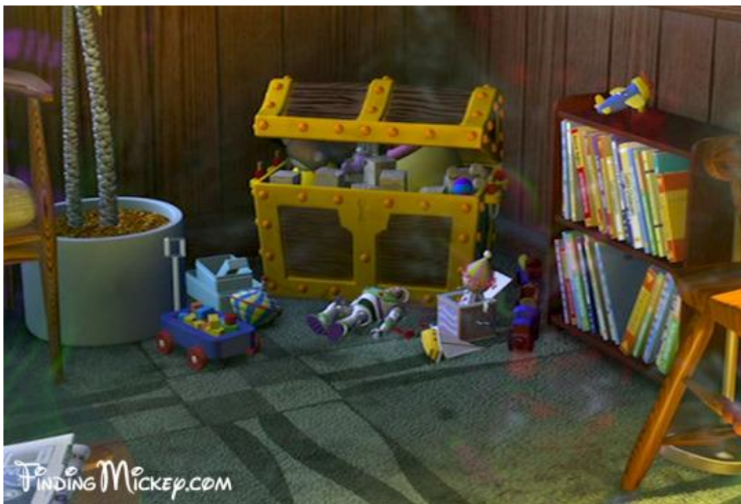
Slika 6. Buzz Svjetlosni iz trilogije Priča o igračkama u crtanom filmu Potruga za Nemom