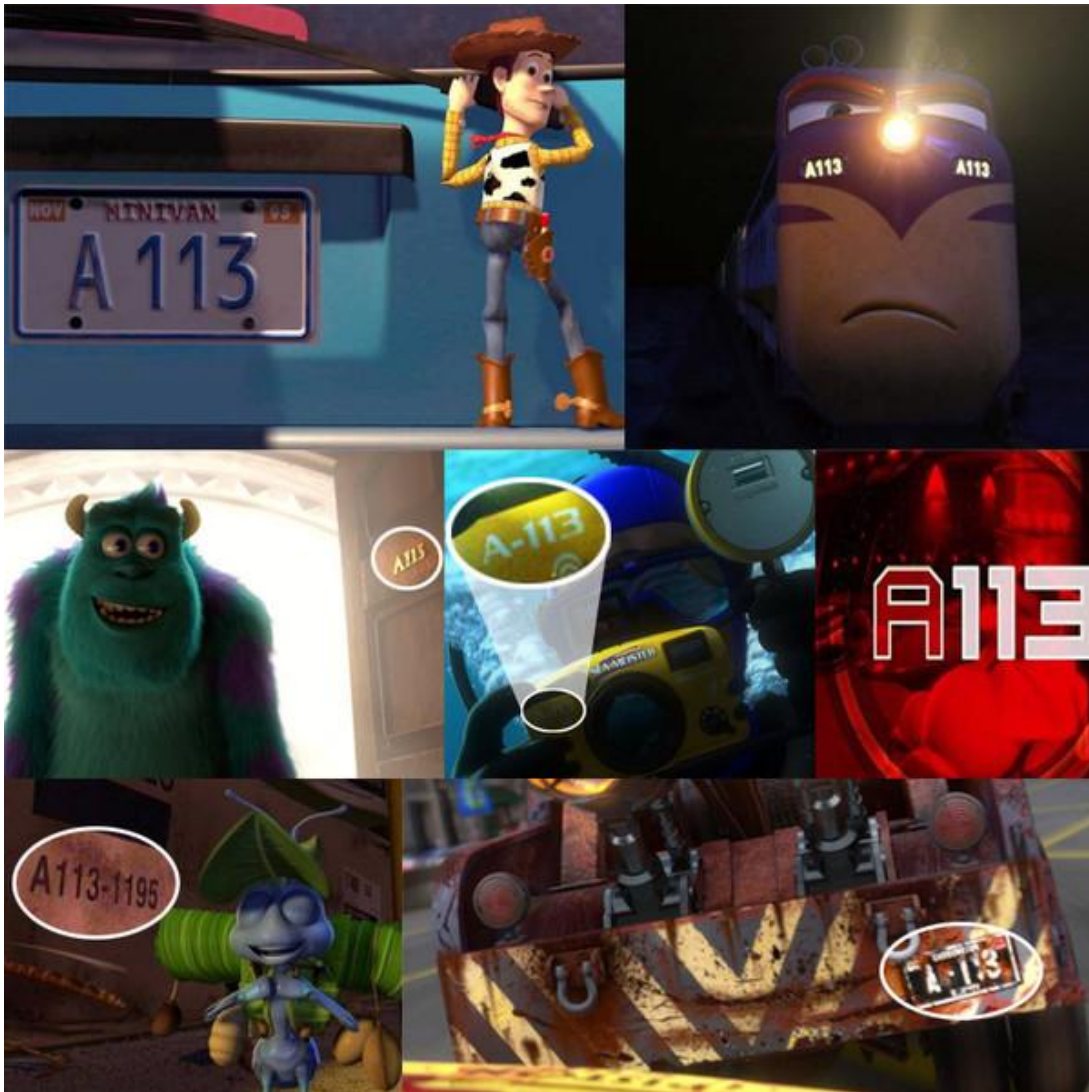
Slika 10. Oznaka „A113“ u Pixarovim crtanim filmovima

Najzanimljiviji je ipak detalj, navodi Williams (2017.) što se u svakom Pixarovom filmu pojavljuje oznaka „A113“ (slika 10) – referenca na učionicu u kojoj je većina Pixarovih animatora učila svoj zanat. Dakle, Pixarovi su zaposlenici ovoj oznaci pridodali osobno značenje, protumačili su je na konotativan način. Ona njima znači nešto sasvim drugačije nego što bi značila djetetu koje gleda crtani film.