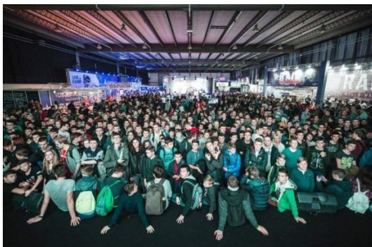
Slika 10. Reboot InfoGamer u Zagreb