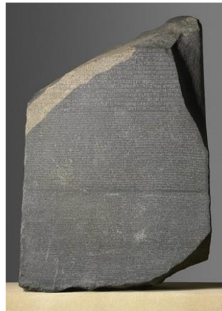
Slika 5. Kamen iz Rozete