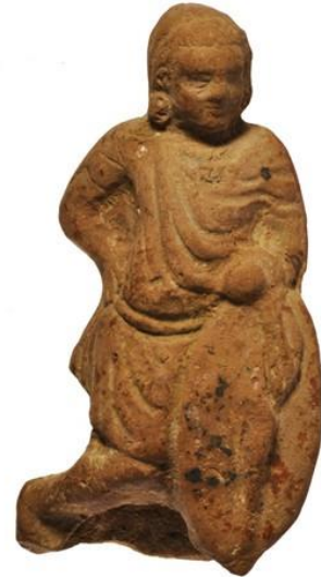
Slika 12. Vojnik naslonjen na galski štit

„domaći“ se podrazumijevalo konjanike koji su imali svoja zemljišta na području Egipta (većinom u nomama Fajum i Oksirink). 138 Oni su uglavnom dolazili iz Makedonije i drugih dijelova Grčke, a zemlja im je bila dodijeljena u zamjenu za vojnu službu. 139 Temelj vojske su sačinjavali teški pješaci čiji je sastav bio osobito mješovit. Osim kraljevske straže, falanga, Libijaca i najamnika iz Grčke također je bio prisutan i znatan broj Egipćana (koji su po prvi put bili teško oklopljeni). 140 Ptolemej I. već uvodi Egipćane u svoju vojsku (u bitki kod Gaze 312. g. pr. Kr.), ali tada nisu imali izraženu ulogu ili čak dostatnu opremu. 141 Treću skupinu kod Rafije su činili laki pješaci iz Krete, Trakije i Galacije. Kelti iz Galacije su često služili kao najamni vojnici na području istočnoga Sredozemlja te su se neki čak naselili u Egiptu. 142 Slonovi su dio egipatske vojske od vladavine Ptolemeja I. koji je prve slonove nabavio od poraženih neprijatelja. 143 Treba napomenuti da su egipatski slonovi (šumski slonovi) kod Rafije bili slabiji (manji) od onih indijskih koje su Seleukidi imali na raspolaganju. 144