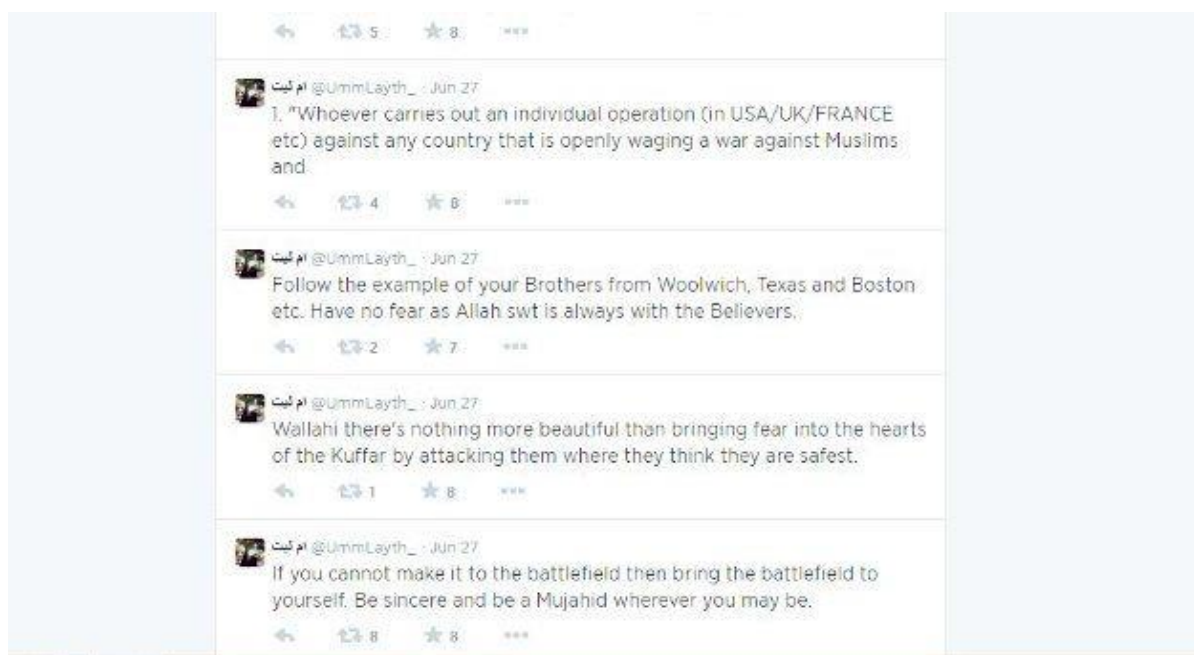
Slika 1 (Bbc.com, 2014)

Putem Twitter-a pripadnici ISIS-a organiziraju debate koje vode njihovi članovi zaduženi za širenje ISIS-ove propagande. Primjerice, zapovjednica ženske brigade Al-Khansaa, Aqsa Mahmood, imala je zadatak vođenja bloga i organiziranja debata na Twitter-u gdje je koristila ime Umm Layth. Najčešće je veličala ISIS i ohrabivala britanske Muslimane za regrutaciju kao što se može vidjeti na slijedeće dvije fotografije (dolje) (Dearden, 2014).