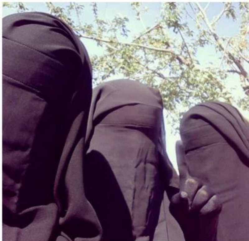
Slika 3 ( News.siteintelgroup.com , 2018)

Umm Layth nije bila aktivna samo na društvenim mrežama, već je zajedno sa ženskom brigadom Al-Khaansom, objavila poseban edukativni manifest koji propisuje pravila ponašanja i obveze žena u Islamskoj državi. Jedno od glavnih pravila koje se proteže kroz cijeli manifest odnosi se na nužnost nošenja crne odjeće koja prekriva svaki dio tijela uključujući i rukavice kako bi se pokrile ruke i prsti (Mah-Rukh, 2015). Prema manifestu koji je poznat pod nazivom „Žene Islamske države: manifest i studija slučaja”, osnovna uloga žene je da bude majka i služi svome mužu i djeci. U manifestu je utvrđeno kako je Zapadno društvo korumpirano, materijalističko i samim time nepovoljno za žene zbog toga što ih udaljava od uloga majke i žene (Mah-Rukh, 2015). Manifest se može protumačiti i kao svojevrsan vodič zbog toga što objašnjava ženama kako trebaju živjeti od djetinjstva do dobi kada su zrele za udaju. Primjerice, od sedme do devete godine djevojčice trebaju biti posvećene razumijevanju religije i znanosti. Od desete do 12 godine trebaju usavršavati