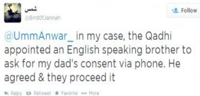
Slika 4 ( News.siteintelgroup.com , 2018)

Slično kao i Umm Layth, djevojka po imenu Umm Anwar također je zaslužna za regrutaciju mnogih žena sa Zapada. Umm Anwar je imala otvoren profil na društvenoj mreži Ask.fm na kojoj su se anonimno postavljala pitanja, a ona je davala odgovore. Tako je na postavljeno pitanje o uvjetima života i stvari koje Islamska država pruža, Umm Anwar odgovorila da Islamska država pruža sve. Na drugo pitanje koje se odnosilo na udaju odmah po dolasku u Islamsku državu, Umm Anwar je odgovorila da „ukoliko sestra ima privatnih problema, ostaje u sjedištu sestara, a za nju se brine Islamska država dajući joj mjesečnu plaću.” ( News.siteintelgroup.com , 2018). Uz odgovaranja na različita pitanja, Umm Anwar je i pomagala djevojkama koje su imale poteškoća oko ispunjavanja uvjeta za dolazak na područje Sirije i Iraka, a imale su podršku svoje matične obitelji: