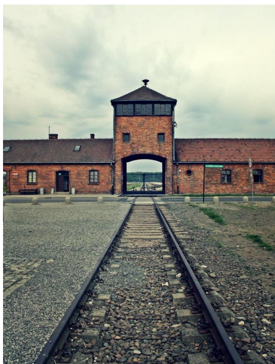
2. Ulaz u Auschwitz II. - Birkenau

U proljeće 1941. godine, Himmler traži od Hössa proširenje glavnog logora, kako bi moglo stati još 30 000 zatvorenika, a za nekih pola godine započela je priča o izgradnji još većeg kampa, koji bi mogao primiti preko 100 000 zatvorenika, tako da u rujnu 1941. imamo prve spomene o novom logoru, odnosno Auschwitzu II. Odluka je pala da će se logor raditi u obližnjem selu Birkenau te su SS-ovci porušili kuće u selu, a seljani su premješteni u neko drugo mjesto. Za projekt novog logora bili su zaduženi Karl Bischoff, šef građevinskog odjela u Auschwitzu i Fritz Ertl, arhitekt. Nakon procjene nacrtu o izgradnji, od početka je jasno kako su planirali da taj logor bude prenapučen. Arhitekti su odlučili u svaku baraku smjestiti oko 744 zatvorenika, a u koju bi optimalno stalo 550 zatvorenika. „Od svakog zatočenika u Birkenauu očekivalo se da preživi na četvrtini prostora na kojoj je živio zatočenik u nekomu koncentracijskom logoru u Njemačkoj.“ 58 Kako je originalni logor Auschwitz bio podignut uz pomoć zarobljenika, isti plan je također bio i za Birkenau.