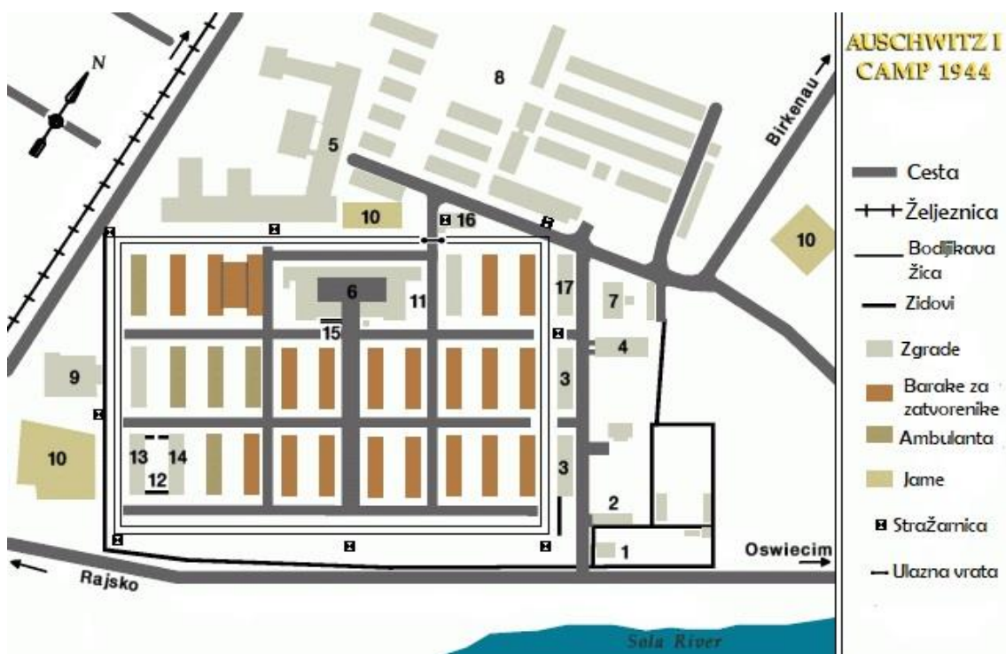
1. Prostorni plan koncentracijskog logora Auschwitz I.

Nakon izgradnje kampa, Auschwitz, odnosno Auschwitz I. kako se danas naziva, sadržao je dvadeset osam blokova. Dvadeset blokova ih je već dočekalo sagrađeno iz bivšeg sastava Poljske vojske i to šest dvoetažnih i četrnaest jednoetažnih. Nakon što se na jednoetažne nadogradio još jedan kat i izgradilo još osam blokova, dolazimo do brojke od dvadeset osam blokova koje su činile logor Auschwitz I. Blokovi koji su bili na dva kata, bili su namijenjeni za 700 zatvorenika, ali je vrlo često znalo biti i 1200 zatvorenika. 56 U početku su spavali na podu, poredani „kao sardine“ u tri reda, jedan do drugoga, krevete su dobili tek početkom 1941. godine. 57