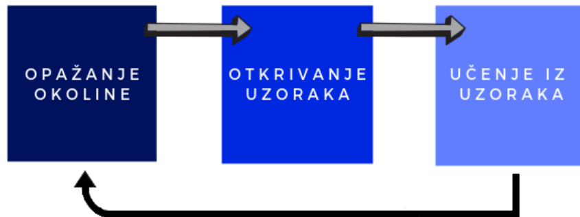
Slika 1. Jednostavni prikaz rada UI

Ta tri koraka se zatim ponavljaju sve dok se ne skupi dovoljno podataka uz pomoć kojih stroj može pouzdano predviđati i donositi odluke.