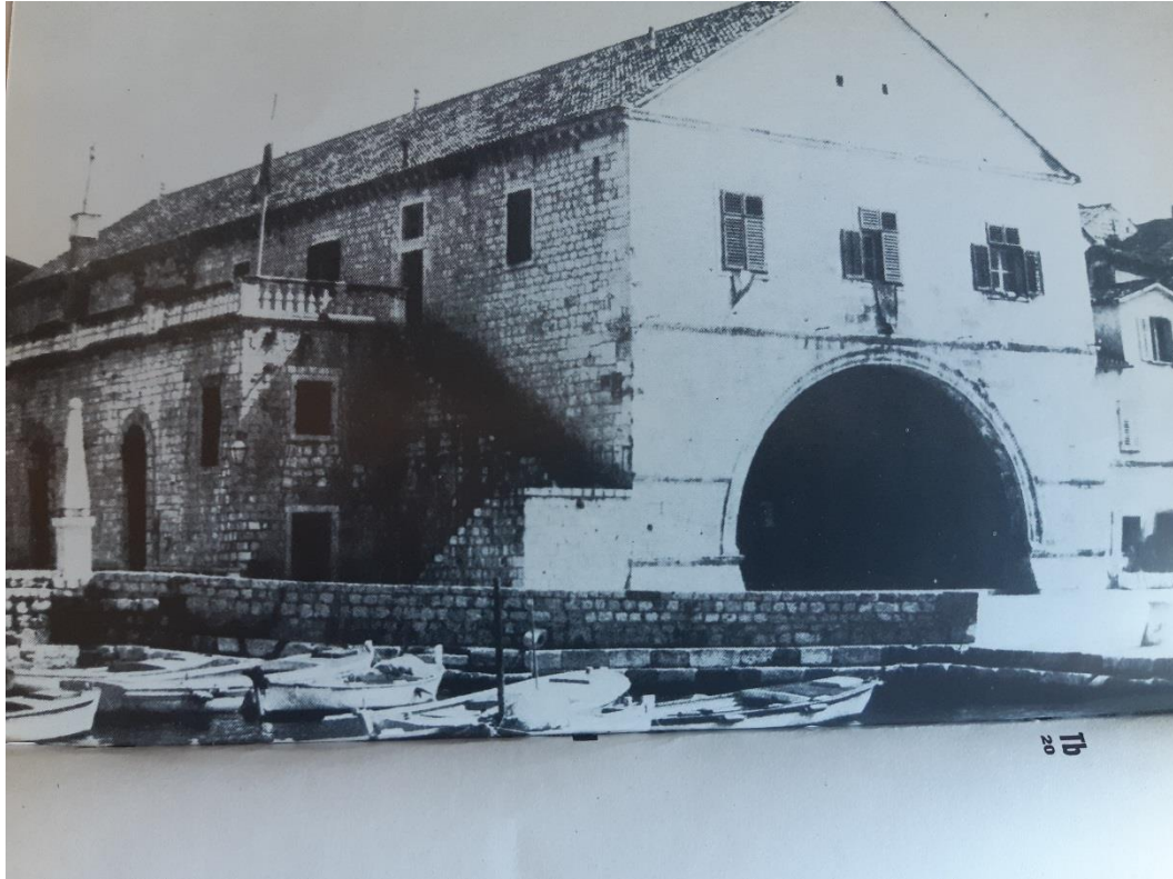
SLIKA 3: Zgrada Arsenala u Hvaru u kojem je od 1612. prvi kat bio preuređen u kazališni prostor (S.P. Novak, Hrvatska drama do Narodnog preporoda , 1984.)