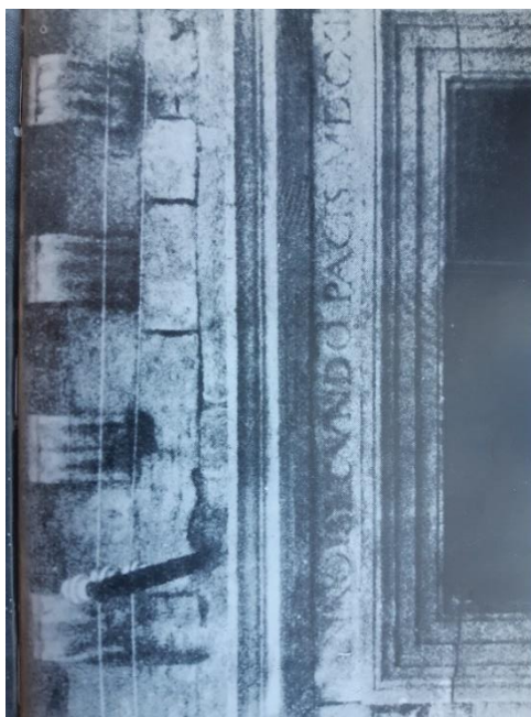
SLIKA 2: Nadvratnik hvarskog kazališta s natpisom: ANNO SECUNDO PACIS MDCXII (S.P. Novak, Hrvatska drama do Narodnog preporoda , 1984.)