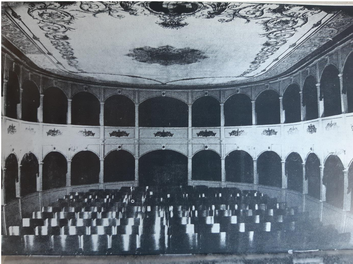
SLIKA 1: Gledalište hvarskog kazališta (S.P. Novak, Hrvatska drama do Narodnog preporoda , 1984.)