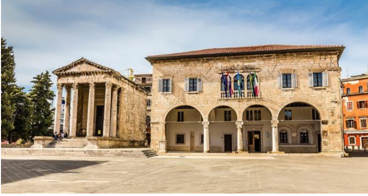
Slika 7. Prikaz Foruma danas