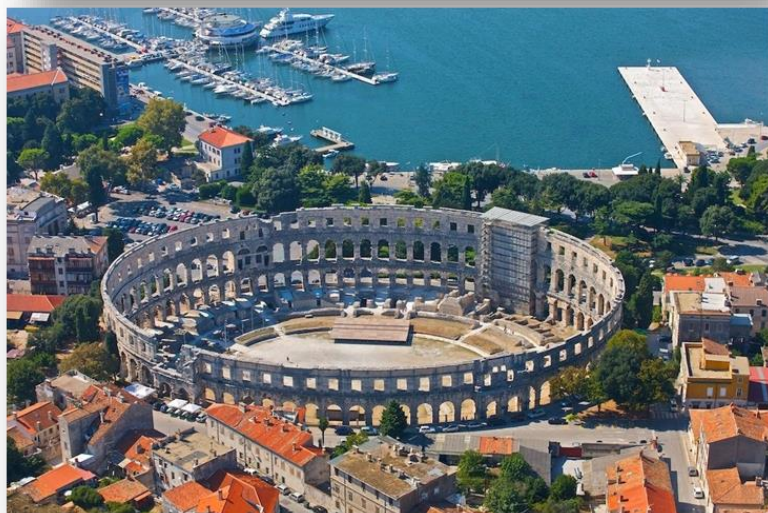
Slika 11. Prikaz Amfiteatra.