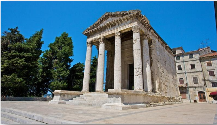
Slika 8. Prikaz Augustovog hrama