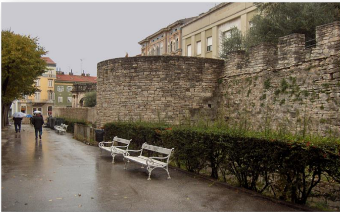
Slika 5. Prikaz gradskih bedema