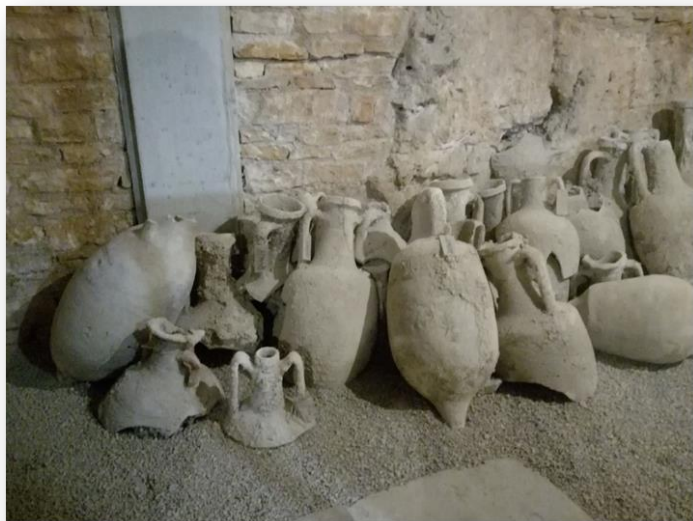
Slika 12. Prikaz Amfora koje su služile za pohranjivanje maslinovog ulja i vina.