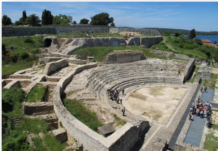
Slika 10. Prikaz Malog rimskog kazališta.