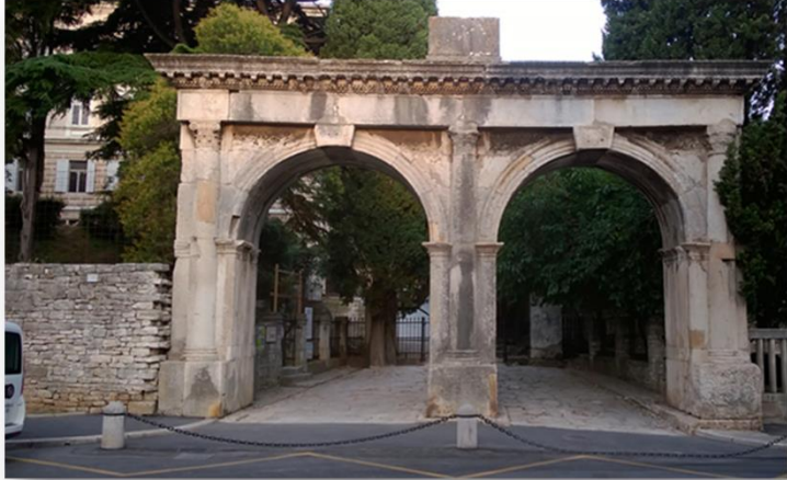
Slika 4. Prikaz Dvojnih vrata