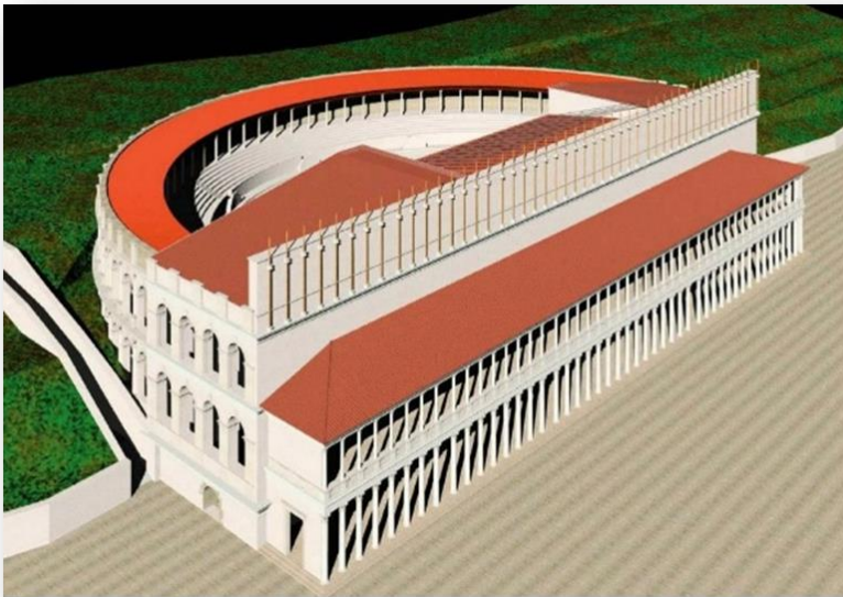
Slika 9. Rekonstrukcija Velikog rimskog kazališta