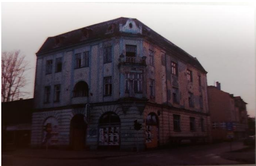
Kuća obitelji Schlesinger.