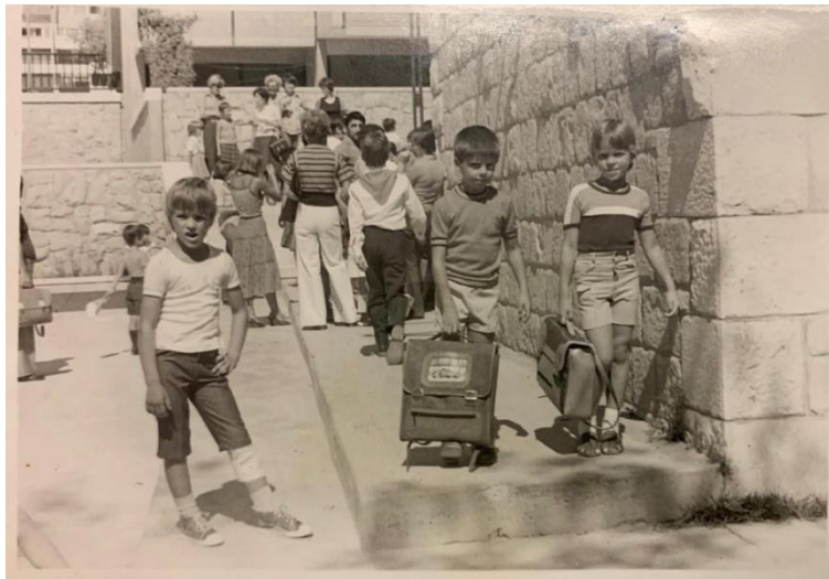
Slika 9 – Osnovna škola Vinko Paić Ožić