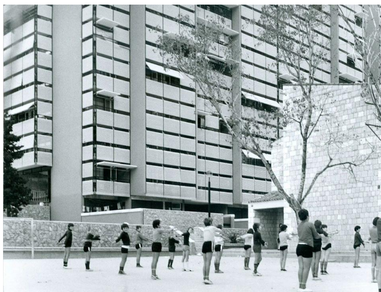
Slika 8 – Sat gimnastike ispred Osnovne mješovite škole „Naroda Lučca“