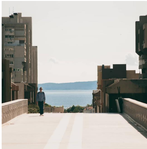
Slika 3 – Pješačka ulica na Splitu 3