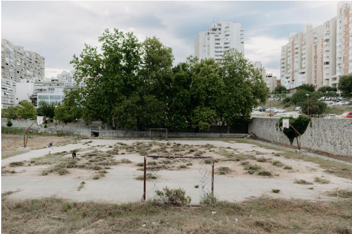
Slika 12 – Napušteno igralište na Trsteniku (R1 zona)