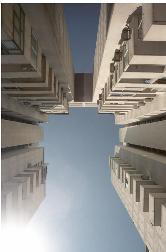
Slika 1 – Ulica Dinka Šimunovića