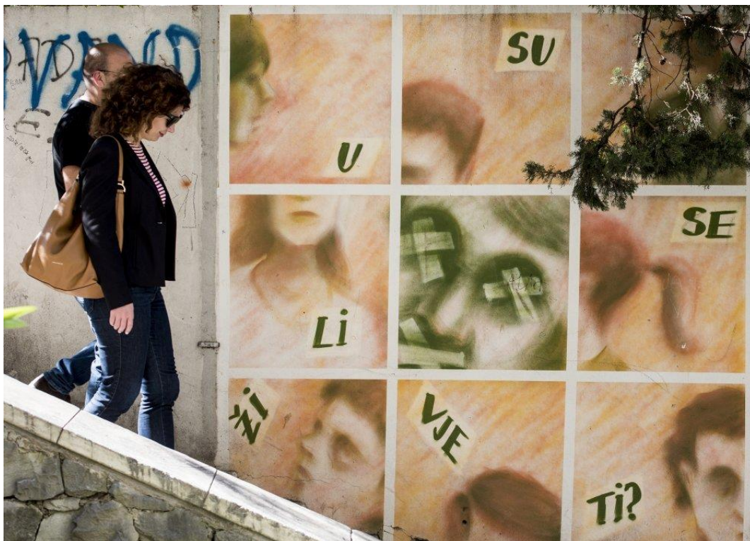
Slika 11 – Jedan od grafita Udruge Kvart