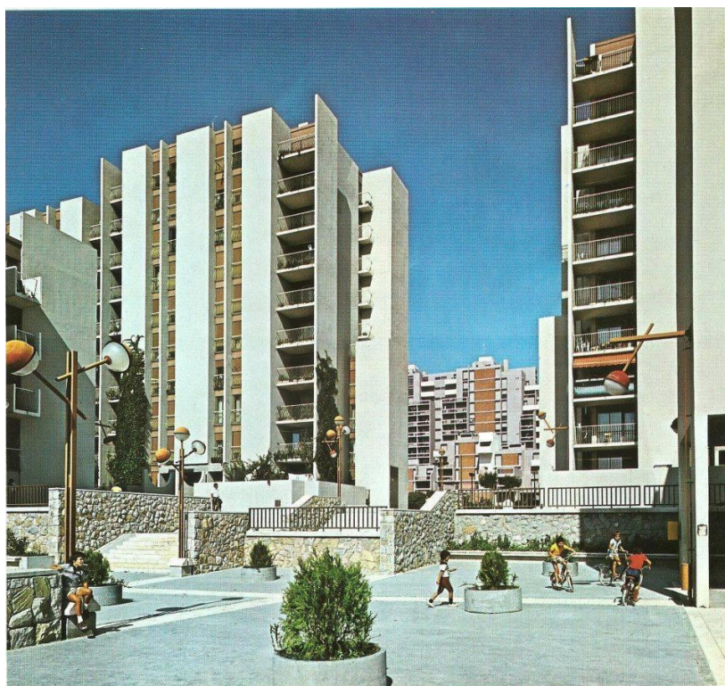
Slika 5 – Život na ulicama Trstenika