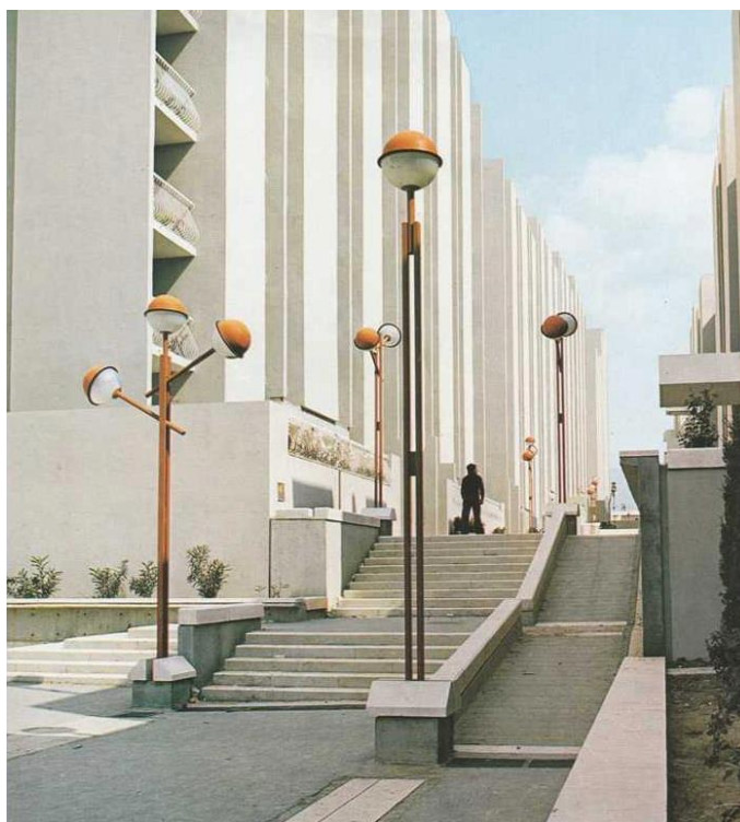
Slika 4 – Ulica Šime Ljubića