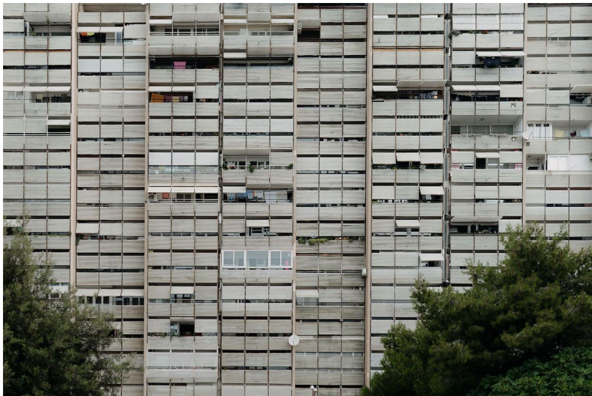
Slika 10 – Prepoznatljivi „brisoletji“ arhitekta Ive Radića