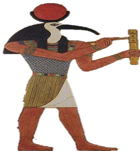
Prilog 3: Slikoviti prikaz boga Tota

Tot je bio poznat kao pisar bogova, kao redoviti zapisničar i objavljiivač njihovih odluka pa su ga stoga smatrali za glasnika bogova. Zbog toga su ga u grčkom razdoblju poistovjetili s Hermesom. No, kao Raova pisara i tajnika štovali su ga pisari i svi učeni ljudi u Egiptu, uključujući, dakako, i svećenike. Oni su ponekad bili skloni uveličati ulogu svoga boga zaštitnika pa su tako, primjerice, zahtijevali da-preminuli faraon koji je danju bio ujedinjen s Raom, noću bude izjednačen s Totom, mjesecom. 62 Tota su najčešće prikazivali kao čovjeka s ibisovom glavom koji nosi polumjesec i kolut. 63