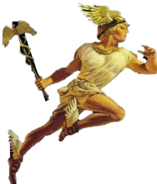
Prilog 2: Slikoviti prikaz grčkog boga Hermesa

U ptolomejskom Egiptu, na primjer, govornici grčkog jezika identificirali su egipatskog boga Tota kao egipatski oblik Hermesa. Dva su se boga štovala kao jedan u Totovom hramu u Khemenuu, gradu koji je na grčkom postao poznat kao Hermopolis. 50 To je dovelo do toga da Hermes dobije attribute boga prevođenja i tumačenja, ili općenito, boga znanja i učenja. Totov epitet pronađen u hramu u Esni, „ Tot veliki, veliki, veliki “, 51 počeo se primjenjivati na Hermesa početkom najranije 172. pr. Kr. Time je Hermes dobio jednu od svojih najpoznatijih kasnijih titula: Hermes Trismegistos ( Ἑρμῆς ὁ Τρισμέγιστος ), „ triput najveći Hermes “. Lik Hermesa Trismegista kasnije će utjeloviti niz drugih ezoteričnih mudrosnih tradicija. 52