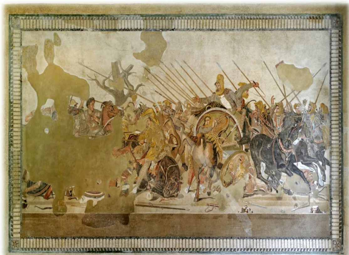
Prilog 1. Mozaik bitke kod Isa

U studenom 333. pr. Kr. odigrala se značajna bitka kod Isa između makedonskog vladara Aleksandra III. I perzijskog kralja Darija III. Kodomana o kojoj svjedoči jedna od najpoznatijih slika antike – mozaik u Pompejima.