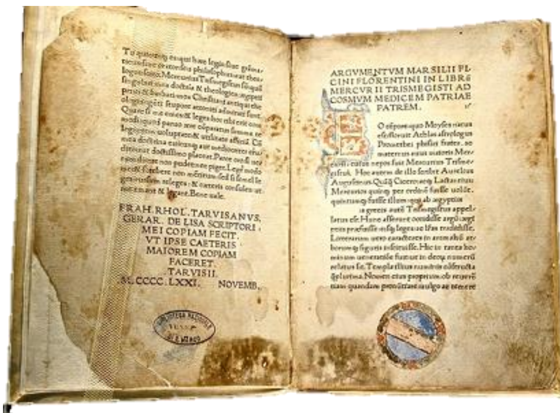
Prilog 4. Corpus Hermeticum : prvo latinsko izdanje. Zbirku je 1463. preveo Marsilio Ficino, a tiskana je 1471. godine.

Sredinom 15. stoljeća Cosimo Medici, gradski vladar iz Firenze, šalje redovnike u razne dijelove Europe sa zadatkom da pronađu zaboravljene antičke tekstove. 80 Godine 1460. redovnik Leonardo iz Pistoie, pronalazi u makedonskom manastiru stari rukopis pisan grčkim jezikom. Kodeks je sadržavao 14 rasprava pripisivanih Hermesu Trismegistu, drevnom egipatskom mudracu. 81 Marsilio Ficino, najznačajniji predstavnik renesansnog platonizma, prihvaća Medicijev prijedlog te postaje voditeljem novoosnovane Platoničke akademije u Firenzi. Jedan od Ficinovih velikih angažmana bio je prevođenje Corpusa Hermeticuma na latinski jezik. Ficinov prijevod dovršen je 1463. godine, a objavljen 1471. godine, a u sljedećih 150 godina tiskan je najmanje 22 puta. 82 Djelo je postalo jako popularizirano u razdoblju renesanse te je utjecalo na velike talijanske filozofe renesanse poput Marsilia Ficina, Pica della Mirandole, Giordana Bruna, Frane Petrića i drugih.