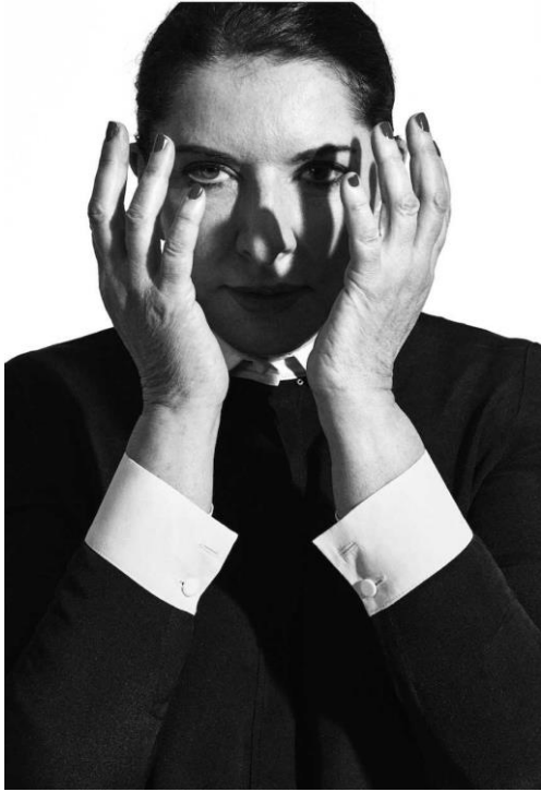
Slika 1 Marina Abramović