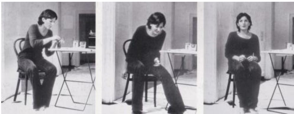
Slika 4. Ritam 2 (performans 6 sati), Galerija suvremene umjetnosti, Zagreb.

civiliziranja. Gledajući Ritam 2 iz ovog ugla: »[...] nezakonitost, neregularnost korištenja lijekova na zdravom tijelu (umjetnice) mogli bi se tumačiti kao pokušaj degradiranja i pervertiranja tih institucionalnih metoda, mehanizama moći kojima se tijela odmetnuta od kontrole (razuma) pokušavaju provesti u normalnost, u društveno prihvatljivo.« (Racanović, 2019: 25). Takvom diverzijskom izvedbom u galerijskom prostoru Abramović kritizira sistem društvenosti i sistem umjetnosti radikalnim zastupanjem prava neposlušnih i otuđenih tijela kako bi se priznala njihova aktivna uloga u društveno i umjetničko relevantnim pozicijama i procesima.