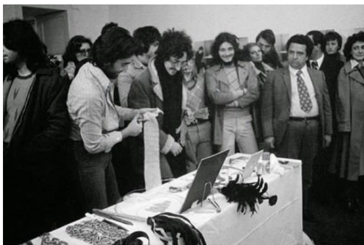
Slika 7. Ritam 0