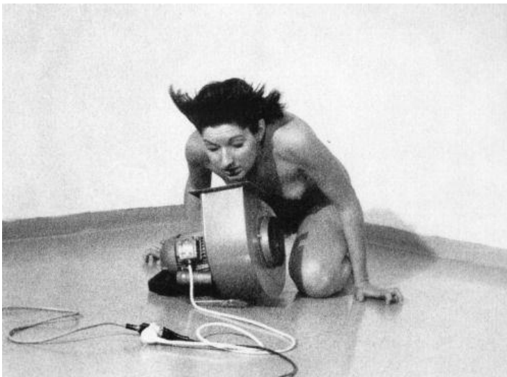
Slika 5. Ritam 4

tijelo odradilo scenarij. Tu možemo povući paralelu s čovjekom koji se sve više povlači u nesvjesno stanje, a unatoč tome izvršava svoje obaveze, svoj scenarij. Promatrači su kod njezinog padanja u nesvijest zaključili da je u opasnosti te su joj ponovno, kao i kod izvođenja Ritma 5 , odlučili pomoći te je to neplanirano postalo dijelom performansa. Upravo te intervencije i nikad identična izdržljivost tijela i uma čine performans specifičnom vrstom umjetnosti: »Ovakve su me reakcije na moj rad potaknule na moj najopasniji performans. Što ako, umjesto da ja izvodim performans na sebi, dopustim publici da odluči što će sa mnom?« (Abramović i Kaplan, 2019: 70). Kao nekada u areni, publika diže palac gore ili dolje za performerera i njegov život.