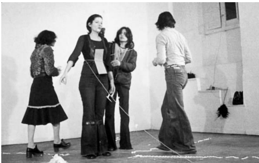
Slika 8. Ritam 0 (performans 6 sati)