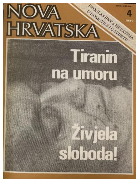
Slika 1. „Trenutak, koji se dugo očekivao – kraj tiranina.“

Prvog siječnja 1980. Tito se preko televizije obratio naciji s novogodišnjom čestitkom, a zdravlje mu se činilo kao nikada bolje. 30 Dva dana nakon navedenog događaja, Tito zbog upale noge odlazi u bolnicu u Ljubljani koja je smatrana najboljom bolnicom u Jugoslaviji iz koje je bio otpušten dva dana nakon. Dana 12. siječnja, Tito je održao svoj posljednji sastanak, nakon kojeg je ponovno morao otići u bolnicu iz koje više nikada nije izašao. Noga mu je bila amputirana, a netom prije uspješnog oporavka, krenuli su navirati drugi problemi. 31