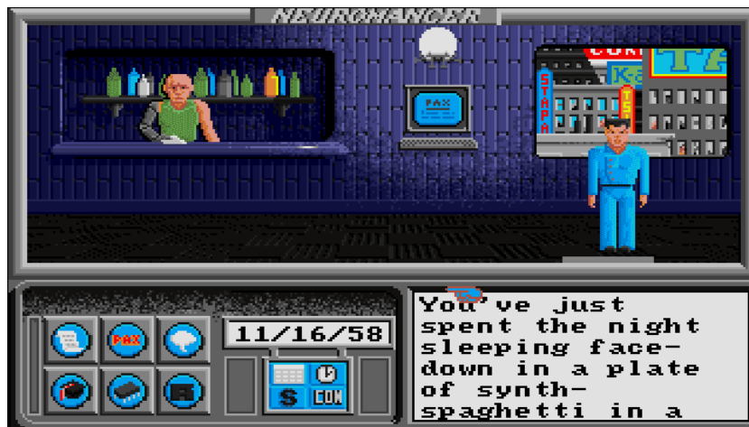
Slika 2. Prikaz „ Neuromancer: The Game “, Interplay Productions.

scenariji u kojima se možete zaglaviti, kao u prvoj sceni. Protagonist se nalazi u restoranu nakon skupog obroka. Vaš lik ima opciju podići novac iz banke i platiti račun ili može večerati i pobjeći, i biti uhićen i osuđen za svoje zločine. 23