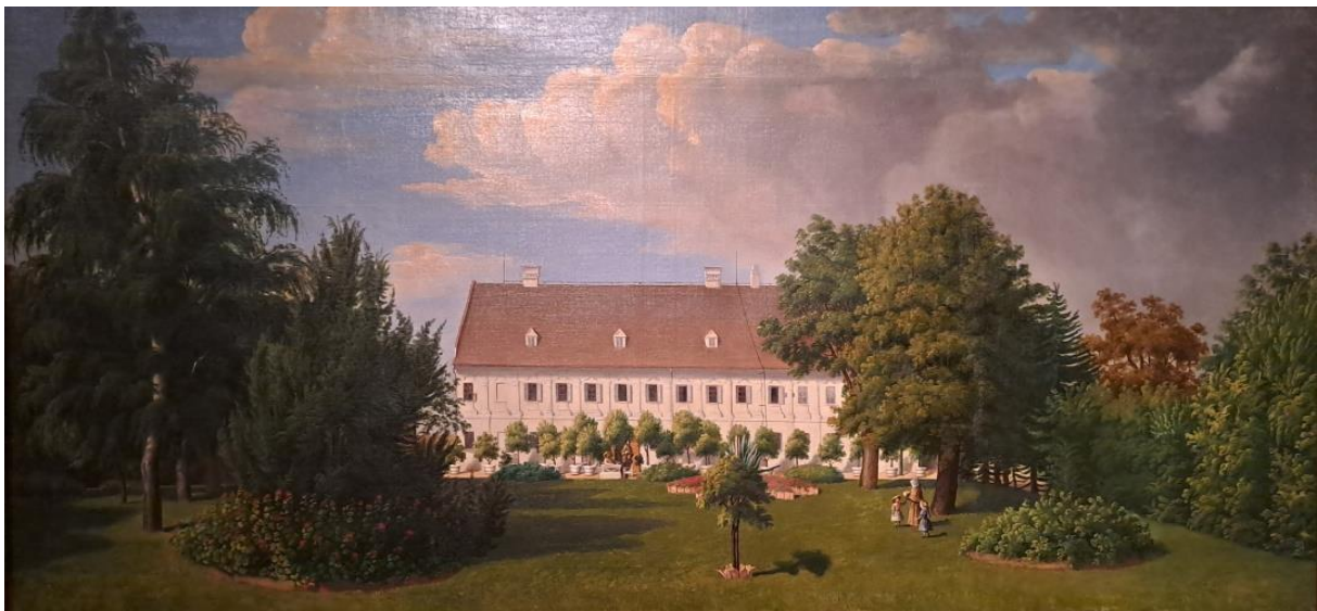
Slika 5. Dvorac Eltz u Vukovaru. Sredina XIX. stoljeća

Prema svemu navedenom možemo pretpostaviti kako ubojstvo grofa Huga Eltza nije bilo slučajno ili splet nesretnih okolnosti. Hrvatski je ban očito imao povjerenja u vukovarskog vlastelina imenovavši ga članom Odbora za pomirenje s Ugarskom, što bi značilo da je grof Eltz, više-manje, podupirao politiku Hrvatskog sabora i bana. Optužbe kako je potajno bio saveznik Mađara nemaju smisla ako uzmemo u obzir da je Dimitrije Rogulić, pristaša mađarske stranke nagovarao seljake da otimaju vlastelinsku imovinu, tj. imovinu svoga (navodnog) saveznika. Osim Mađara, jedino je Glavnom odboru, odnosno Josifu Rajačiću smetao Jelačićev utjecaj u Srijemu, naročito u zapadnom dijelu Srijemske županije gdje je Rajačić, bezuspješno, čitavu 1848. i 1849. godinu pokušavao uspostaviti svoju vlast te Srijem pripojiti tzv. Srpskoj Vojvodini. Vukovarski je grof, kao vlasnik najvećeg vlastelinstva u županiji i podupiratelj bana Jelačića zasigurno bio prepreka Glavnom odboru. Ubojstvom grofa Eltza obezglavljeno je Vukovarsko vlastelinstvo, a samim time i Vukovar, odnosno zapadni dio Srijemske županije te oslabljen utjecaj bana Jelačića na tom području. Na velika je vrata uvedena anarhija na područje vlastelinstva te na taj način, u konačnici, provedena pljačka najbogatijih područja Srijemske županije. Za politički motivirano ubojstvo vukovarskog vlastelina, čini se, naposljetku nitko nije odgovarao.