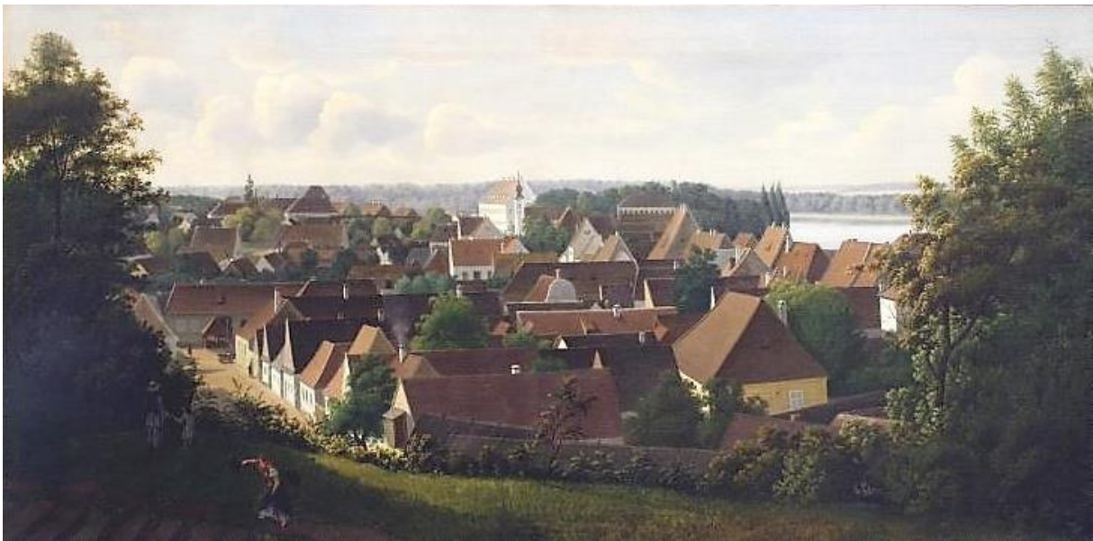
Slika 3. Pogled na Vukovar . Sredina XIX. stoljeća

Neprestani hrvatsko-srpski sukobi, koji su izbili neposredno nakon uzastopnih pobjeda narodnjaka na županijskim skupštinama, govore nam kako je hrvatsko-srpsko iliti ilirsko bratstvo i jedinstvo postojalo samo u teoriji. Gotovo ne iznenađujuće, zagrebačke novine nisu pisale o ovim sukobima, vjerojatno strahujući da bi oglašavanje takvih događaja samo dovelo do većeg raskola među Južnim Slavenima. Ipak, sukobi su Srijemsku županiju, u trenutku kada je budućnost cjelokupne Monarhija bila neizvjesna, doveli do gotovog bezvlađa. Stvari su izmakle kontroli do te mjere da je hrvatski ban, najviši autoritet u Trojednoj kraljevini morao osobno intervenirati. Pritom su kaos i neslogu iskoristili Mađari te na vlast vratili Josipa Žitvaja, osobu koja je par mjeseci ranije bila podvrgnuta prijekom sudu, i omogućili mu da unazadi (gotovo sav) mukotrpan rad bana Jelačića i narodnjaka. Nakon što su Žitvaj i njegove pristalice konačno uklonjeni, Vukovarci i Srijemska županija počeli su činiti ustupke drugoj nacionalnoj politici koja će postaviti temelje za dugoročne sukobe i suprotstavljene politike.