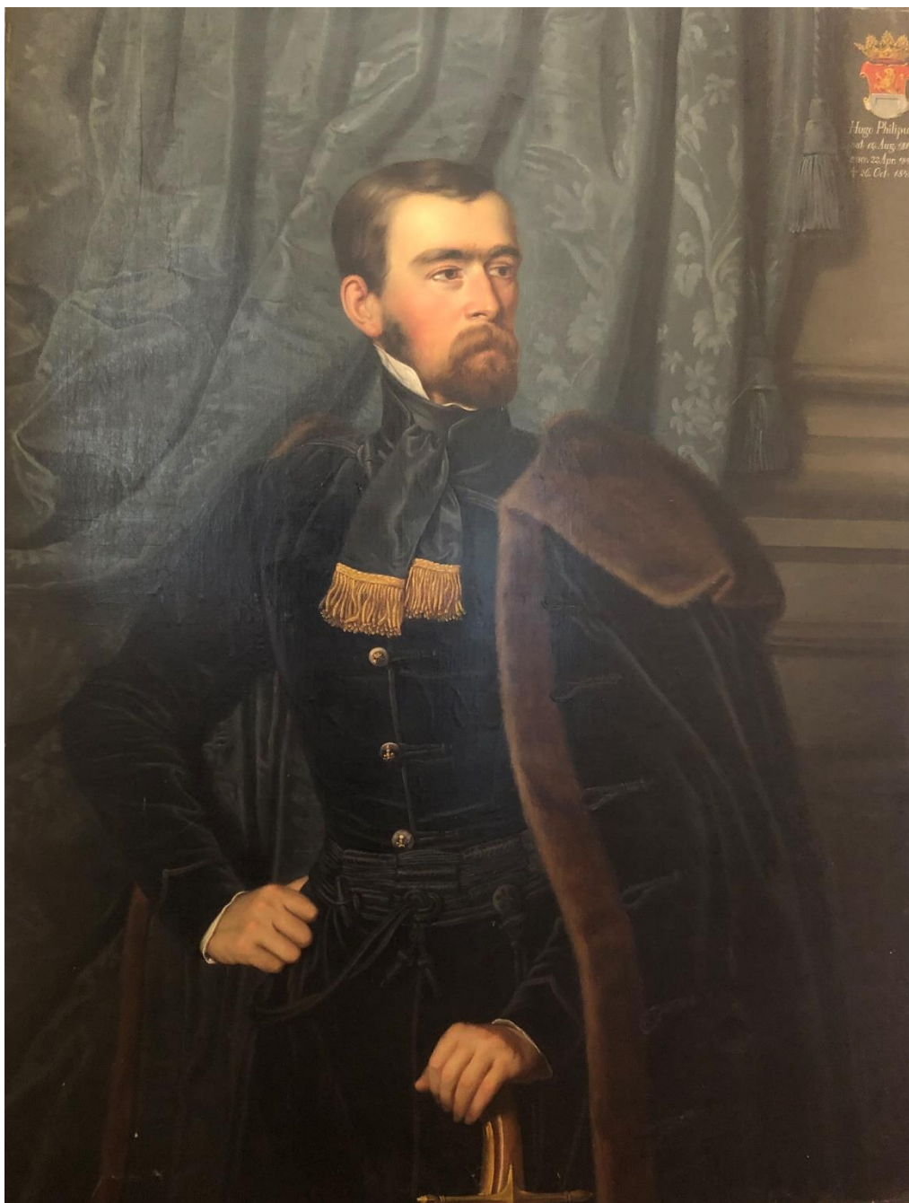
Slika 4. Hugo Philipp Karl Franz Johann Nepomuk Graf zu Eltz-Vukovar

Eltzova podrška narodnom pokretu očitovala se i u travnju 1848. godine u trenutku kada se imala održati sudbonosna skupština Srijemske županije. Podijelivši, iz Osijeka doneseno, oružje narodnoj straži, kao načelnik povorke poveo je dvije stotine ljudi kroz varoš te pred narodom povikao je na hrvatskom jeziku: „ da živi sloboda, da živi kralj, mir i red! “. Izjava vlastelina iznenadi okupljeni narod te, kako prenose Novine dalmatinsko-hèrvatsko-slavonske „ iz sviuh gèrlah zaori jednodušni gromoviti, više putah ponavljani »živio! « 172 . Da je grof Eltz