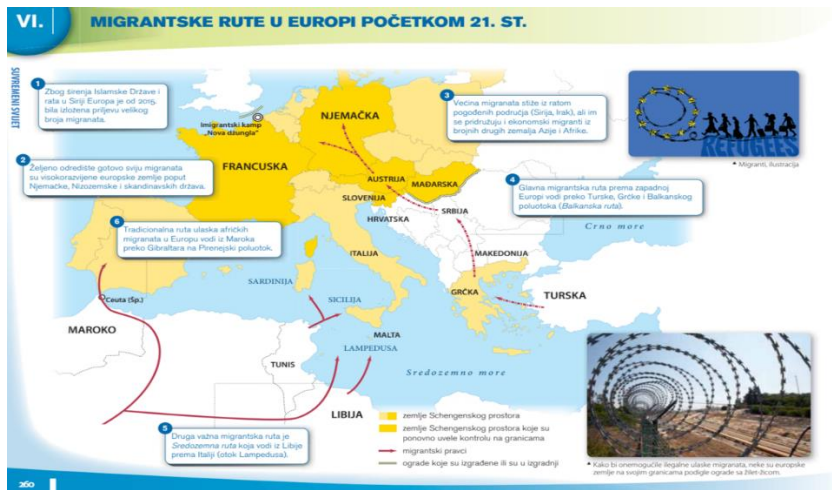
Slika 1. Migrantske rute u Europi početkom 21. stoljeća.

Od 2015. godine mediji, političari i znanstvenici su situaciju počeli opisivati kao krizu iz tri glavna razloga: povećanog broja dolazaka tražitelja azila, nespremnosti koju je pokazao Zajednički europski sustav azila (eng. Common European Asylum System – CEAS) odgovarajući na sve veći broj zahtjeva za međunarodnom zaštitom i pokušaja nekolicine političkih stranaka i vođa da pridobiju većinsku podršku na izborima inzistirajući na temi priljeva izbjeglica. Prema podacima UNCHR-a (2018.) na vrhuncu takozvane europske izbjegličke krize diljem svijeta predano je više od tri milijuna zahtjeva za azil. Iste je godine Europska unija zaprimila otprilike milijun zahtjeva, dok je prvih šest zemalja po broju zahtjeva ukupno zaprimilo 1.737,131 zahtjeva. Europska unija je zaprimila otprilike trećinu ukupnog broja zahtjeva za azil podnesenih u svijetu. Ako promatramo isključivo priljeve u Europu tijekom 2015. države članice zaprimile su ukupno 2.700.000 zahtjeva za azil, premda su međunarodnu zaštitu odobrile za samo 327.955 osoba. Iste je godine, prema podacima agencije Frontex 1.822.177 osoba zatečeno duž vanjskih granica EU u pokušajima neovlaštenog ulaska u Europsku uniju (Milardović i Brčić Kuljiš, 2021).