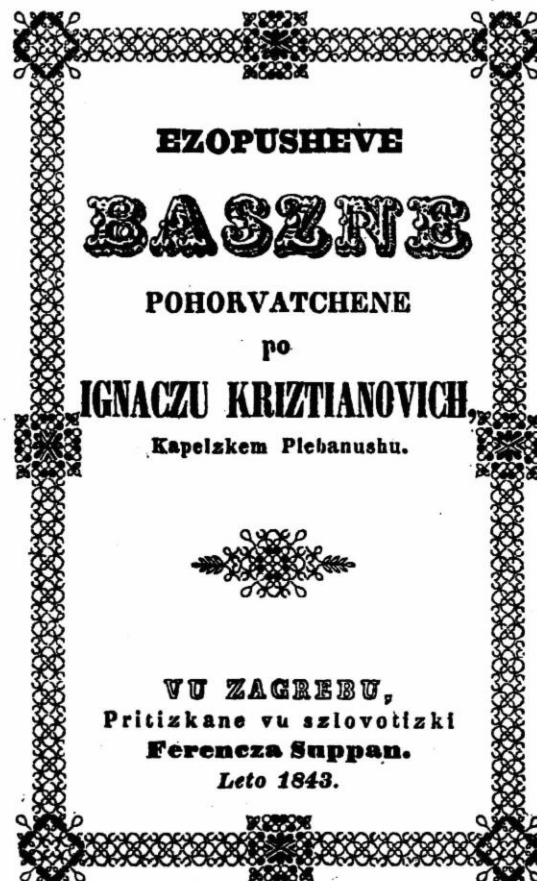
Naslovnica Ezopovih basana u Kristijanovićeovom izdanju (1843.).