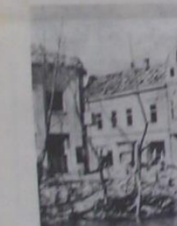
Centar grada nakon oslobodjenja. Most na Vučki mlinici su nepravilno pri povlačenju

Ostalo je malo od prošlog leta... Prve armije poginule i prognane fašiste i sa ovog područja.