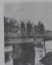
Most preko Vuke kod veslačkog kluba popravlja ju jedinice naše armije nakon ulaska u Vukovar