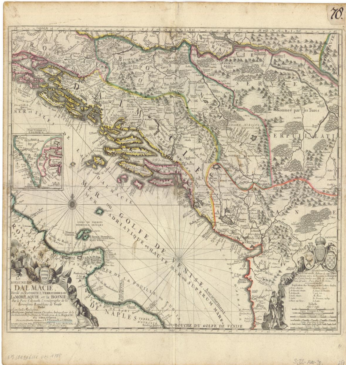
Karta 3. Vincenzo Maria Coronelli, Karta Jadranskog mora, XVI. st.