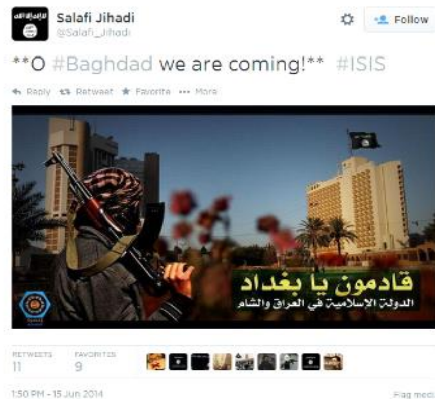
Slika 1. Hashtag kampanja za vrijeme napada Islamske države na grad Mosul

na arapskom podrazumijeva „one marljive“. Uz pomoć njih radikalni islamisti uspješno su provodili svoju strategiju na društvenim mrežama. U kratkom roku uspjeli su objaviti velik broj hashtagova (#) koji su ubrzo postali trend, a priča se potom pretvorila u kampanju. Upravo je uz pomoć tih kampanji Islamska država uspijevala zastrašiti vanjske promatrače, ali i privući potencijalne borce (Berger, Morgan, 2015: 29). Tako je u lipnju 2014., za vrijeme napada na irački grad Mosul, uz pomoć aplikacije Dawn objavljeno gotovo 40 tisuća tweetova . Također, velik broj korisnika aplikacije počeo je objavljivati slike naoružanih džihadista koji gledaju prema zastavi Islamske države, a u kojima je pisalo “ We are coming Baghdad ”. Svatko tko je u tom trenutku u tražilicu upisao „Baghdad“ pojavila se slika kampanje (Slika 1) 4 (Berger, 2014).