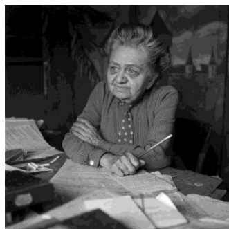
Slika 1. 1

Prvi dio završnog rada obuhvaća raspravu o Mariji Jurić Zagorki kao prvoj hrvatskoj novinarki i književnici. Zatim će Zagorka biti opisana kao prva domaća sufražetkinja. U trećem dijelu će biti razrađena rodna problematika koja uključuje transvestiju, odnosno preodijevanje ženskih u muška lica, problem vještica i progona žena. Zadnji dio završnog rada bavit će se poveznicom s autobiografskim romanom Marije Jurić Zagorke, Kamen na cesti .