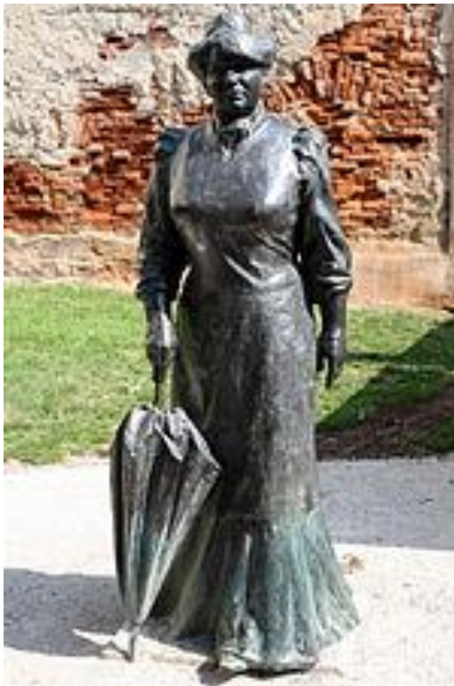
Slika 2. 4

Proučavanje najsitnijih oblika književnosti dovelo je do spoznaje da trivijalna i umjetnički vrijedna književnost nemaju principijalne i kategorijalne nego one gradualne razlike. Također je otkriveno kako već u samim začecima književnog izražavanja postoje i književni oblici bez stilskog intenziviranja. Dakle, Zagorkini romani su neopravdano dobili etiketu „šunda“ te je ona s pravom bila povrijeđena. Takav pojam se većinom pripisuje djelima koja obiluju literarnom veličanju ogoljelog nagona, kao što su nasilje ili seks, koji su izdvojeni iz totaliteta ljudskosti. Za razliku od navedenog, Zagorkin prikaz onodobnog progona vještica bio je ogorčena pobuna protiv obezvrjeđivanja ljudskog u čovjeku (Sekulić, 1973: 114).