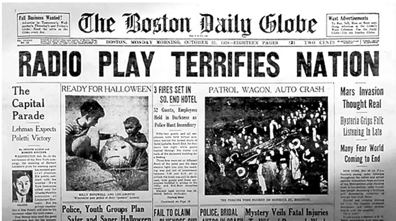
Slika 1: The Boston Daily Globe, October 31, 1938.

Nakon Prvog svjetskog rata nastavilo se s emitiranjem propagandnih sadržaja, bitan primjer jakog utjecaja medija na ljude je radio-drama Orsona Wellesa, Rat svjetova (The War of the Worlds). Ova radio-drama emitirana je 1938. godine na CBS-u, trajala je 60 minuta i izazvala je opću hysteriju među slušateljima (History, zadnji pristup:16. 8. 2017.). Portal The Telegraph (CHILTON, 2016.) ističe činjenicu da je simulacija dolaska izvanzemaljaca na Zemlju, rušenje zgrada, ljudska vriska te sveopće opsadno stanje, koje su glumci uspjeli dočarati, stvorilo paniku među slušateljima. Nadalje, spominje se i to da je Rat svjetova prilično dobar primjer kako mediji mogu manipulirati ljudskom psihom (CHILTON, 2016.). Ova radio-drama dobar je pokazatelj medijske moći. Iako, potrebno je napomenuti da je Orson Welles prije početka Rata svjetova naglasio da je riječ o radio-drami. Unatoč tome, ljudi su počeli širiti paniku koju nije očekivao nitko, osim Orsona Wellesa.