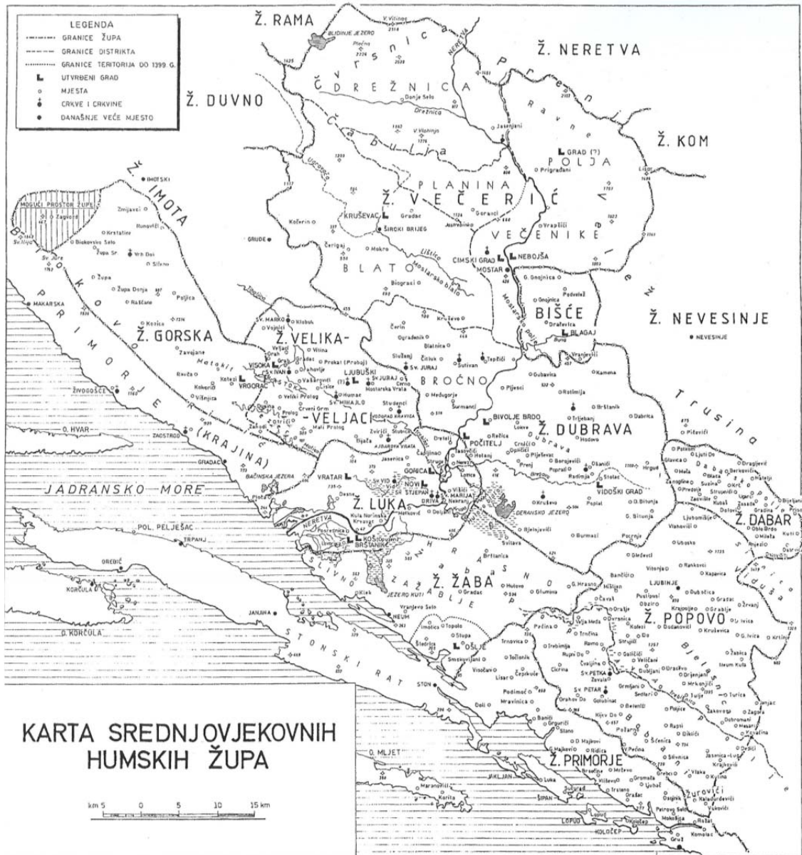
Karta 1: Srednjovjekovne humske župe