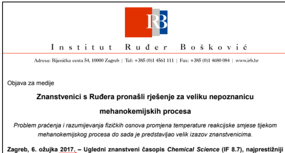
Slika 3: Prikaz pogrešno navedenog datuma (Novak, Znanstvenici s Ruđera pronašli rješenje za veliku nepoznanicu mehanokemijskih procesa )

Iako to nije velika pogreška u smislu da novinarima nedostaje važan dio informacije ili da sami neće shvatiti da je došlo do nenamjerne greške, ona se ne bi smjela ponavljati. Međutim, ista se pogreška ponovila i 10 dana kasnije, dakle, već u sljedećoj objavi za medije.