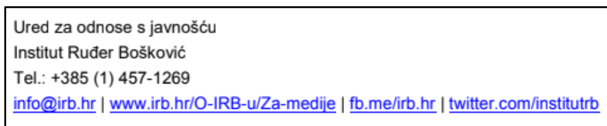
Slika 4: Prikaz izmijenjenih kontakt podataka (Novak, Zimska škola o naprednim analizama podataka i heterogenim računalnim arhitekturama )

Nadalje, od ukupno 20 analiziranih tekstova, njih tri ne sadrže kontakt podatke Hrvoja Novaka na početku ili kraju tekst, već je kao glavni kontakt naveden Ured za odnose s javnošću.