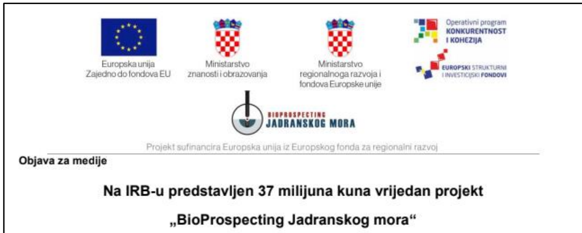
Slika 1: Prikaz logotipa partnerskih institucija (Novak, Na IRB-u predstavljen 37 milijuna kuna vrijedan projekt 'BioProspecting Jadranskog mora' )

Zbog toga su, logotip i podaci IRB-a nužno prebačeni iz zaglavlja u podnožje objave uz nedostatak adrese, telefonskog i telefaks broja. Također, zbog velike količine prostora koji zauzimaju logotipi partnerskih institucija, kontakt podaci i funkcija Hrvoja Novaka prebačeni su na kraj teksta u objavi.