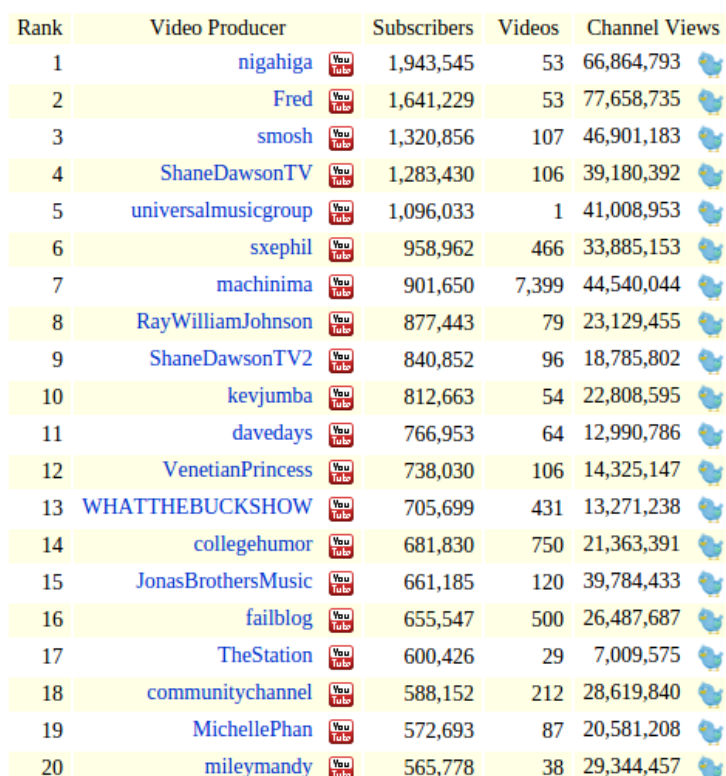
Slika 2. Lista uspješnih YouTubera 2010.

Prema korisničkim imenima YouTubera na listi može se iščitati kakav sadržaj je te godine bio najgledaniji, odnosno koji kreatori su bili najpopularniji na mreži. S najvećim brojem pretplatnika i pregleda kanala YouTuberi nigahiga (Ryan Higa), Fred (Lucas Cruikshank), smosh (dvojac Ian Andrew Hecox i Anthony Padilla) i Shane Dawson bili su najpraćeniji. Zbog postignutih brojki 2010. su smatrani velikim YouTube imenima, što je u usporedbi s njihovim današnjim statistikama zapravo vrlo mala praćenost. Do 2018., u osam godina razvitka YouTubea kao zajednice i razvitka vlastitih kanala i sadržajne orijentiranosti na njima (uglavnom komedija i sketchevi ), svi su pretvorili svoje kanale u multimilijunske kreativne jedinice na platformi. Tako nigahiga danas ima 21 milijun pretplatnika, kanal smosh broji 23 milijuna, a Shane Dawson gotovo 18 milijuna pretplata. Jedino je Fred u usporedbi s ostalima ostao „manji“ YouTuber koji je u osam godina privukao samo dodatan milijun pretplata. Iza njih, na listi su i korisnici poput whatthebuckshow-a i RayWilliamJohnsona (komičari) te Michelle Phan ( beauty vlogerica). Sadržajno različiti, pokazatelji su preferencija tadašnje publike koja je, prema njihovim kanalima, voljela gledati komediju, „talk showove“ i sadržaje o ljepoti. Ipak, posljednja tri navedena YouTubera danas više ne djeluju na platformi i ugasili su svoje kanale.