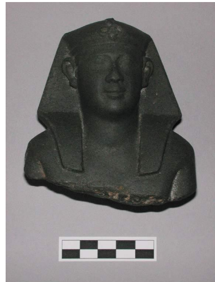
Slika 4. Ptolemej V.

Vladavina Ptolemeja IV. Filopatora (222. – 204. g. pr. Kr.) i njegovih nasljednika, obilježena je postupnim slabljenjem kraljevstva i gubitkom prekomorskih posjeda. 27 Ptolemejevići više ne mogu računati samo na plaćenike te grčko i makedonsko stanovništvo da im popunjavaju vojsku, već se počinju oslanjati na egipatsko stanovništvo. To postaje očito tijekom bitke kod Rafije 217. g. pr. Kr. u kojoj je Ptolemej IV. porazio Seleukide. 28 Od tada pobune Egipćana postaju sve češće, pogotovo na jugu zemlje. 29 U nastojanju da smiri nezadovoljstvo, maloljetni Ptolemej V. Epifan (204. – 180. g. pr. Kr.) se kruni u Memfisu, staroj egipatskoj prijestolnici. 30 Memfis je bio sjedište visokih svećenika boga Ptaha, kojih je tijekom ptolemejske vladavine bilo trinaest. 31 Ubrzo nakon krunidbe svećenici su se okupili u cilju proslave, nakon koje nastaje kamen iz Rozete, kojim se naglašava njihov beneficijalni odnos sa kraljem. 32 Krajem III. st pr. Kr. počinju pobune tijekom kojih nastaju zasebna kraljevstva na području Gornjeg Egipta, točnije u okolici grada Tebe. 33 Samoprogllašeni faraoni su nosili imena koja govore o uzrocima nezadovoljstva, Haronophris i Chaonnophris („Horus je Oziris“ i „Oziris još živi“). Nemiri su napokon prekinuti pogubljenjem pobunjenika 184./183. g. pr. Kr. 34 Zbog gubitka prekomorskih posjeda i sve češćih pobuna, Ptolemej V. se sve više oslanja na Rimsku Republiku za podršku. 35