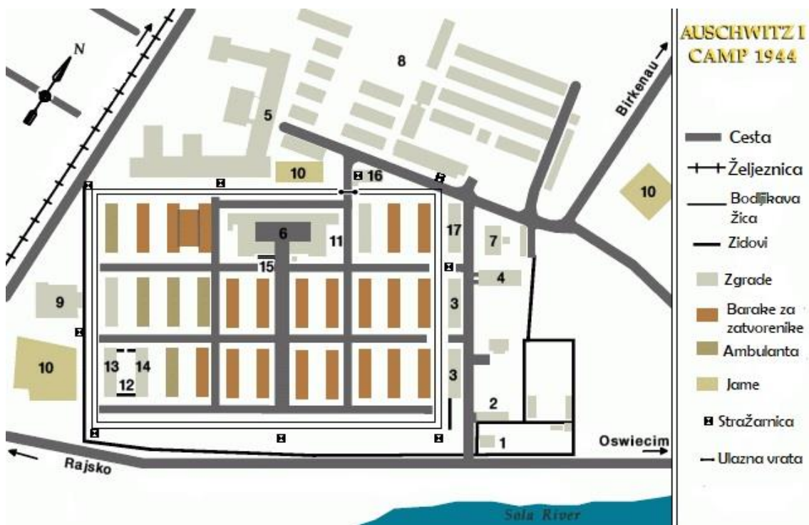
1. Prostorni plan koncentracijskog logora Auschwitz I.

Nakon izgradnje kampa, Auschwitz, odnosno Auschwitz I. kako se danas naziva, sadržao je dvadeset osam blokova. Dvadeset blokova ih je već dočekalo sagrađeno iz bivšeg sastava Poljske vojske i to šest dvoetažnih i četrnaest jednoetažnih. Nakon što se na jednoetažne nadogradio još jedan kat i izgradilo još osam blokova, dolazimo do brojke od dvadeset osam blokova koje su činile logor Auschwitz I. Blokovi koji su bili na dva kata, bili su namijenjeni za 700 zatvorenika, ali je vrlo često znalo biti i 1200 zatvorenika. 56 U početku su spavali na podu, poredani „kao sardine“ u tri reda, jedan do drugoga, krevete su dobili tek početkom 1941. godine. 57