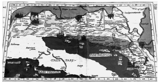
Slika 1. Peta karta Europe

Također, u osmoj knjizi je prikazana karta pod imenom Peta karta Europe koja daje detaljan prikaz Ilirika i Panonije. 26