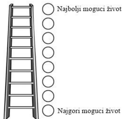
Slika 1. Prikaz Cantrilove skale subjektivne dobrobiti (Sawatzky, 2010)

primjenjiva je za sve dobne skupine. Sadrži pet čestica te pokazuje jako dobru test-retest korelaciju te pouzdanost unutarnje konzistencije (Diener, Emmons, Larsen i Griffin, 1985)