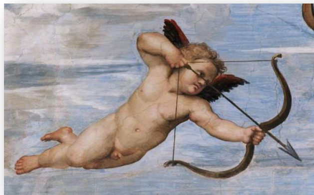
Slika 7: KUPID, BOG LJUBAVI 49

On sam smatra kako mu je bilo lakše dok je bio slobodan ( liber eram I, 9), jer nije znao za takvu bol. Karlo Pucić spominje Kupida 48 ( puer I, 12), čija ga je strelica ranila te ga u gore navedenim stihovima moli da odloži svoje oružje ( tela repone I, 12) i spremi svoj tobolac ( pharetra , I, 12) jer je on već „dovoljno“ zaljubljen.