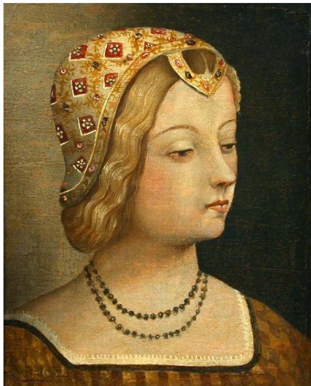
Slika 4: LAURA DE NOVES 32

Ranije je također spomenuto kako je Petrarca bio vrlo obrazovan čovjek, koji je tražio uzore u antičkim piscima i njihovim rukopisima, a je li sam Karlo Pucić tražio uzor u Petrarci prilikom pisanja svoje knjižice? Je li preuzeo njegove motive kako bi idealizirao i uzdignuo svoju ljubav prema Gnezi? Ili je ostao vjeran kopiranju antičkih pisaca?