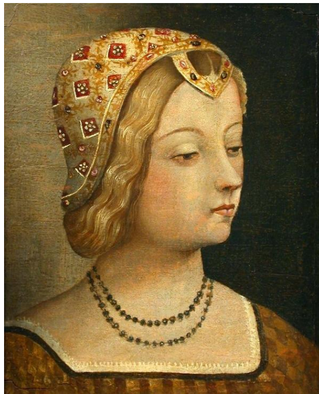
Slika 4: LAURA DE NOVES 32

Ranije je također spomenuto kako je Petrarca bio vrlo obrazovan čovjek, koji je tražio uzore u antičkim piscima i njihovim rukopisima, a je li sam Karlo Pucić tražio uzor u Petrarci prilikom pisanja svoje knjižice? Je li preuzeo njegove motive kako bi idealizirao i uzdignuo svoju ljubav prema Gnezi? Ili je ostao vjeran kopiranju antičkih pisaca?