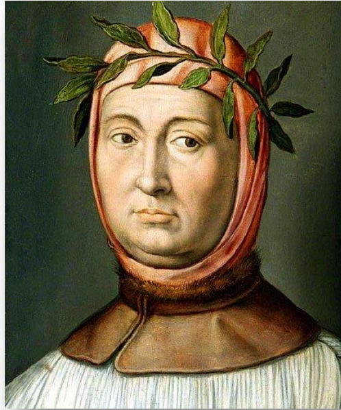
Slika 2: FRANCESCO PETRARCA 23

Francesco Petrarca, sin firentinskog bilježnika, rodio se 1304. godine u Arezzu, gradu u središnjoj Italiji, u kojemu je obitelj živjela oko godinu dana. Iz Arezza se obitelj seli u Incisu gdje se u međuvremenu rodio Gherardo, Francescov brat. Obitelj se ponovno seli u Pisu, pa zatim Avignon, sjedište papinskog dvora 1312. godine, iz kojeg su se ponovno preselili u Carpentras. Studirao je pravo u Montpellieru i Bologni. Nakon neuspješnog studiranja, 1326. godine vraća se nazad u Avignon gdje privlači pozornost svojim njegovanim izgledom i velikom željom te ljubavlju za knjigama. Petrarca se kretao u društvu uglednika te vodio galantan život, ponekad razuzdan, odlazeći na razne gozbe, trudeći se uvijek biti viđen u najsjajnijoj odjeći s najboljom frizurom. Odbijao je sve obveze koje bi mogle sprečavati njegovu slobodu, a kako bi živio bez novčanih briga, primio je niže crkvene redove. To nam je poznato iz pisma Familiars , X, 3 koje piše svome bratu Gherardu. Zaredivši se, Petrarca je ušao u službu moćne obitelji Colonna. 24