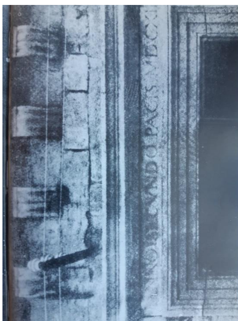
SLIKA 2: Nadvratnik hvarskog kazališta s natpisom: ANNO SECUNDO PACIS MDCXII (S.P. Novak, Hrvatska drama do Narodnog preporoda , 1984.)