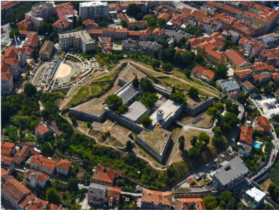
Slika 1. Prikaz današnje Tvrđave iz mletačkog perioda, sagrađenoj na prapovijesnoj gradini