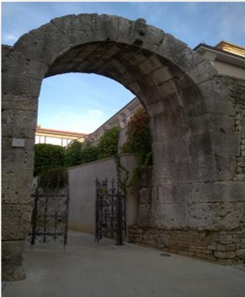
Slika 2. Prikaz Herkulovih vrata