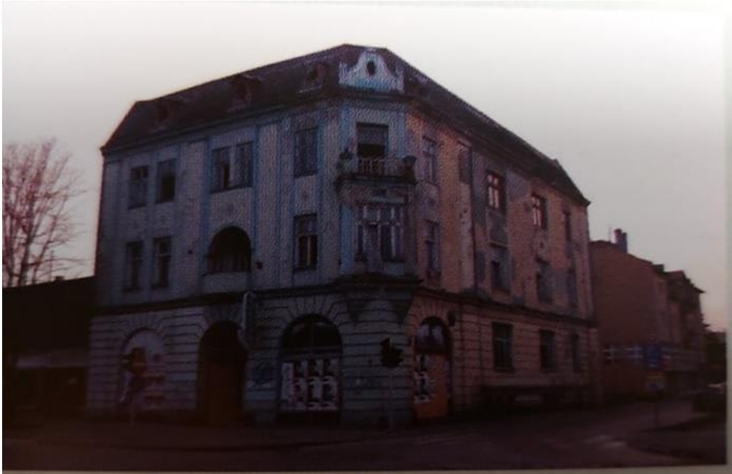
Kuća obitelji Schlesinger.