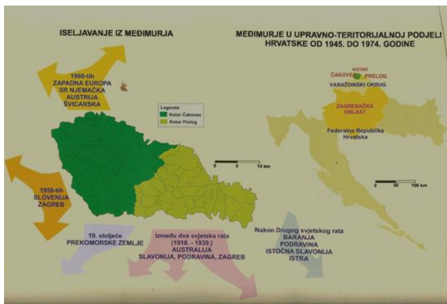
Slika 1. Smjerovi migracijskog kretanja međimurskog stanovništva

Smjerovi vanjske migracije kamo međimursko stanovništvo migrira uglavnom su posljedica geografske blizine i dobre prometne povezanosti. Ujedno su posljedica povijesno-političkih utjecaja u prošlosti (Mesarić Zabčić & Njegač, 2008: 129-131).