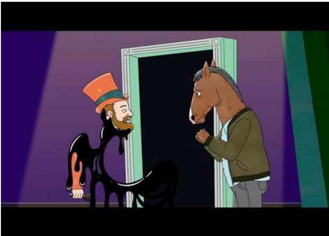
Slika 4. Bojack Horseman [SPOILERS] - The View from Halfway Down

„Neću ti dati sretan kraj. Ne zaslužuješ to. Trebaš živjeti ostatak svog života s tim što si učinio. Trebaš znati da nikada, ali nikada neće biti u redu. Ja umirem! Neću se osjećati bolje. I neću biti tvoj podupirač kako bi se osjećao bolje.“ ( The Telescope 21:12).