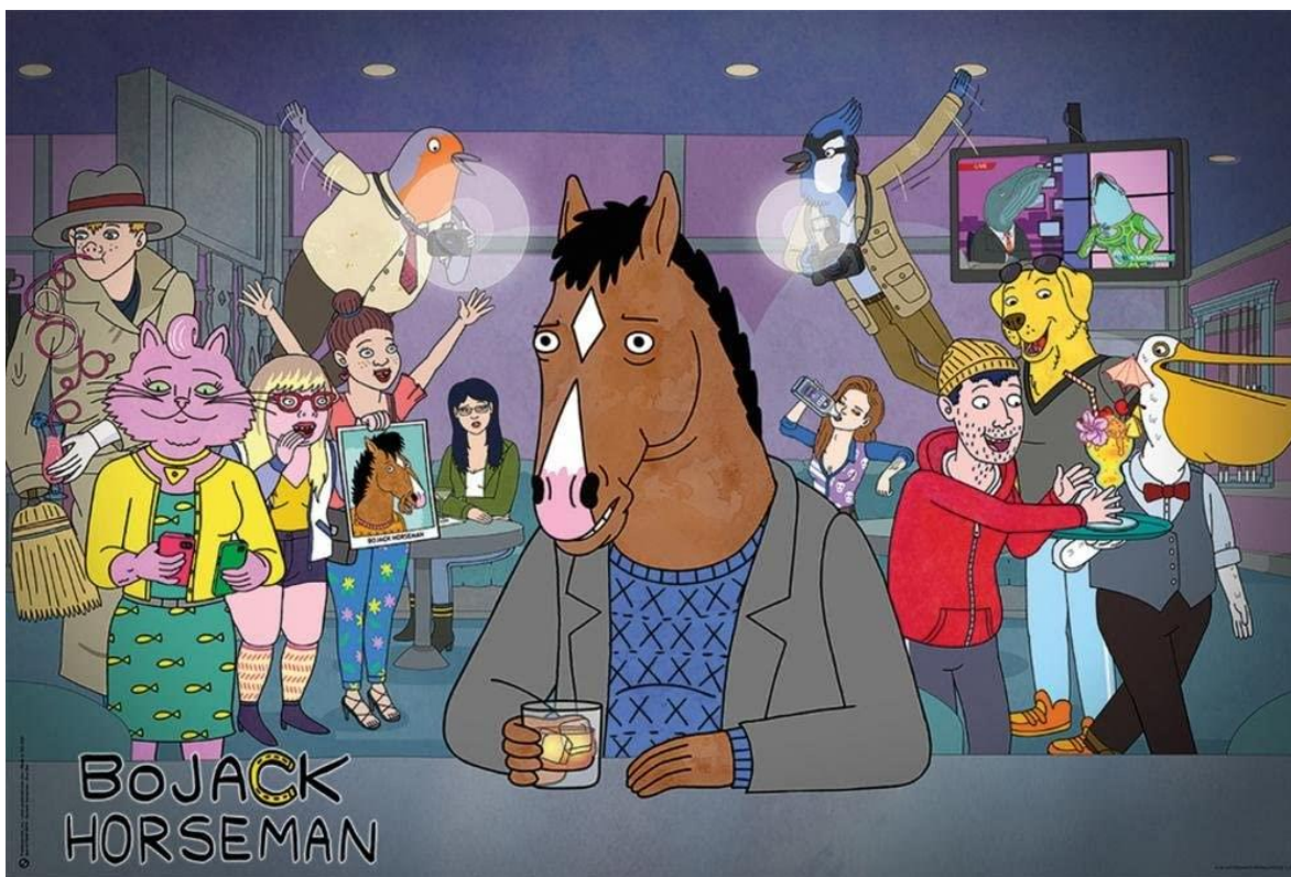
Slika 3. „Bojack Horseman“

hiperrealnosti u postmodernom društvu, kroz različite likove te njihovu egzistenciju u otopljivoj antropocentričnoj hijerarhiji u društvu (De Koster, 2018: 4-5).