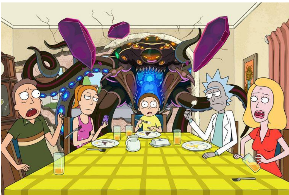
Slika 1. „Rick and Morty“ S05E02