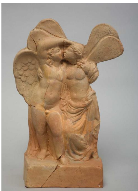
Slika 11. Terakota s prikazom Erosa i Psihe