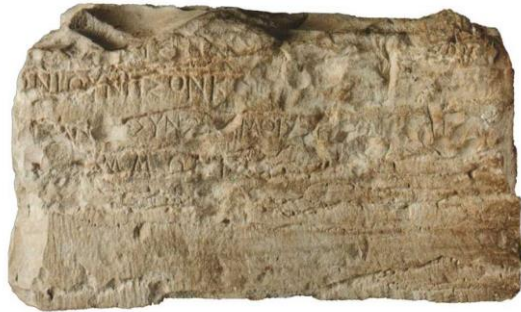
Slika 6. Kamena baza s natpisom „Jonijev otok“, 4. st. pr. Kr.