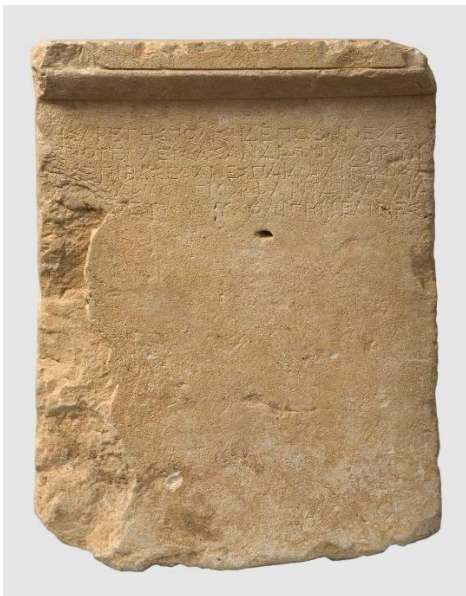
Slika 7. Natpis ratnika Kalije, 4. st. pr. Kr.