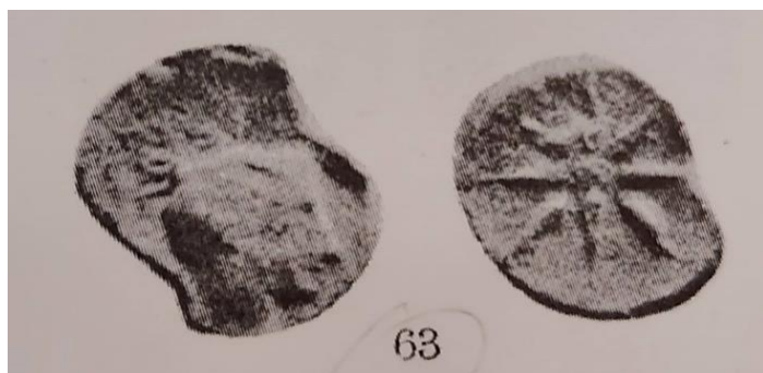
Slika 4. Primjerak novca s glavom nimfe na aversu i zvijezdom na reversu