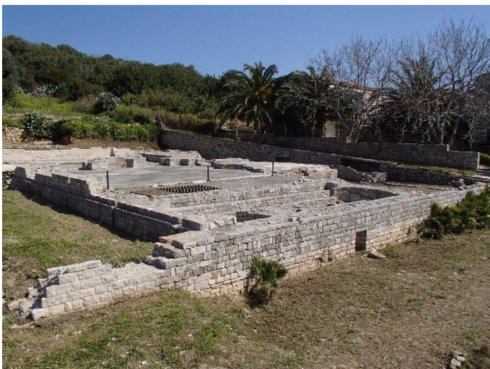
Slika 3. Ostaci rimskih termi