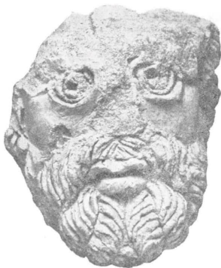
Slika 10. Muška stucco figura