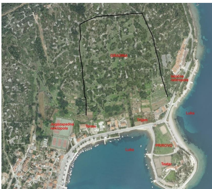
Slika 1. Plan antičkog grada