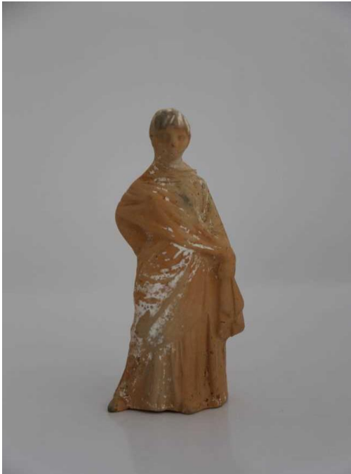
Slika 12. Primjerak tanagra figure, 3. st. pr. Kr.