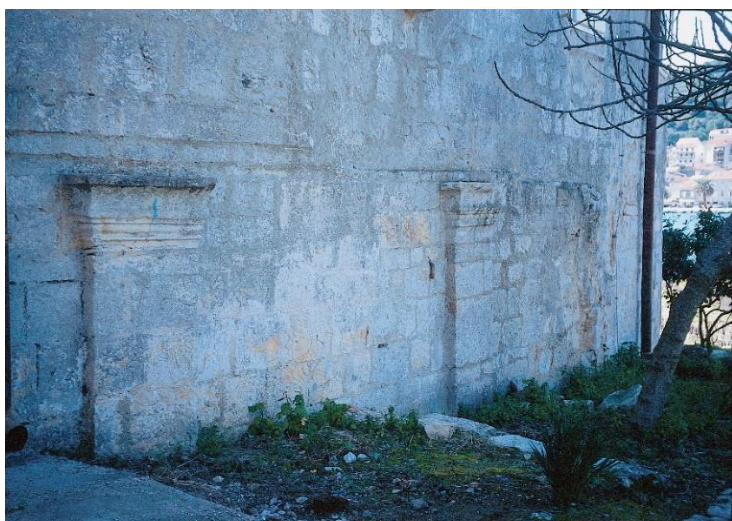
Slika 2. Ostaci rimskog teatra nad kojima je nastao franjevački samostan