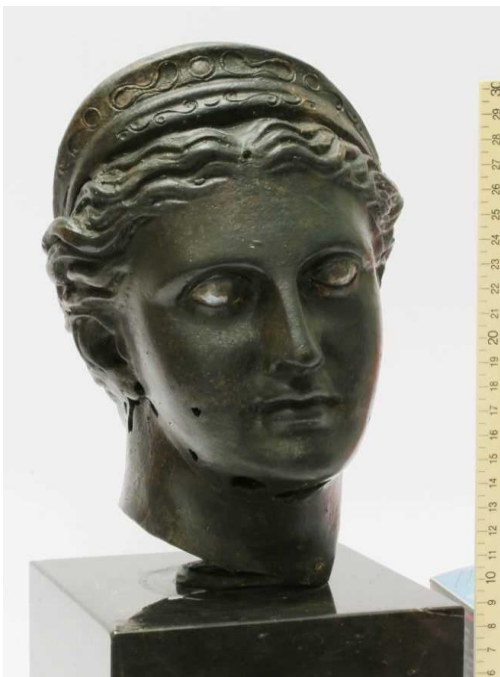
Slika 13. Brončana glava božice Artemide, 4. st. pr. Kr.