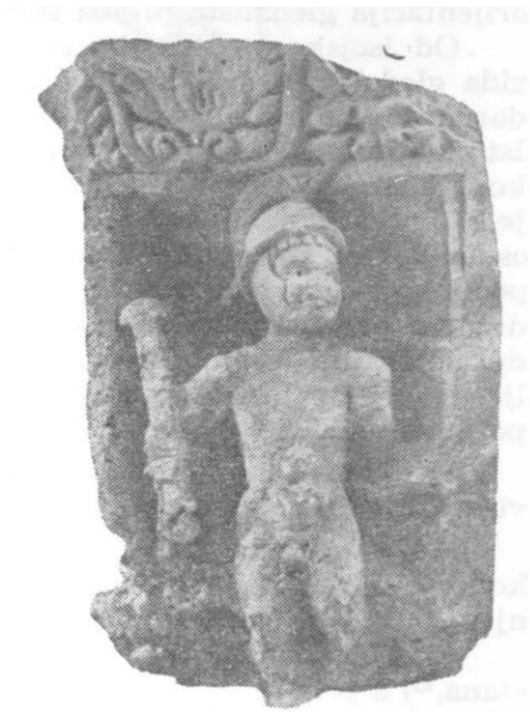
Slika 9. Reljef boga Marsa, dio teatarske skulpture