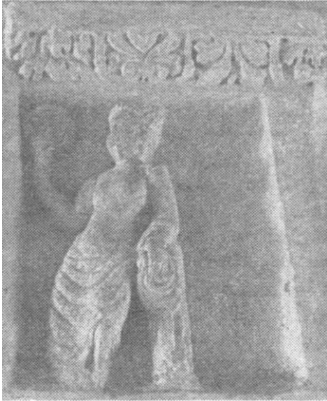
Slika 8. Reljef božice Najade, skulptorski ukras isejskog teatra