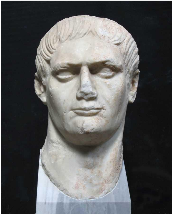
Slika 14. Glava cara Trajana, 2. st.