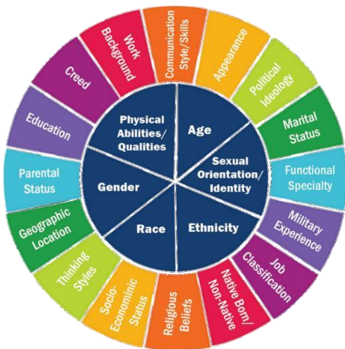
Slika 2. Kotač sastavnica identiteta (Brown, 2022)

Nakon što smo razmotrili neke od bitnih teorija vezane za identitet, za potrebe ovog istraživanja bitno je i definirati aspekte primarnog i sekundarnog identiteta :