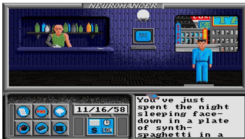
Slika 2. Prikaz „ Neuromancer: The Game “, Interplay Productions.

scenariji u kojima se možete zaglaviti, kao u prvoj sceni. Protagonist se nalazi u restoranu nakon skupog obroka. Vaš lik ima opciju podići novac iz banke i platiti račun ili može večerati i pobjeći, i biti uhićen i osuđen za svoje zločine. 23