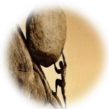
Sizifov posao 32

Ako osjetimo napade straha u nekome, tek tada trebamo biti duplo jači i ustrajniji, i za tog nekog tko ruši prosjek ispravnosti i stabilnosti. Ono što i kršćanska vjera nalaže jest sigurnost u sebe i stajanje čvrsto na zemlji, začepeljivanje ušiju i zaključavanje uma kada nam netko kaže „ne miješaj se, ne tiče te se, ne događa se tebi ta nepravda, ne iznosi mišljenje“ i slično. Samo, svi ti zaboravljaju da se sutra sve to može i njima dogoditi. Zaključit ću jednom mišlju. Baš kada dođemo do točke da su svi protiv nas, da više ne znamo kako dalje, da je najbolje okrenuti se i otići, „odustati dok nije prekasno“, upravo je to trenutak kada će nas svemir obgrliti i kada će se sve okrenuti, upravo tu je taj epicentar uspjeha i taj trenutak kada ne smijemo odustati. Ako tu ostanemo hrabri i dosljedni, od tog trenutka postajemo mali stvaratelji vlastitog uspjeha i time smo pokrenuli jedan maleni kamenčić za boljitak svijeta. Ne takav „kamenčić“ kao Sizif (bez obzira na to što on nema mogućnost promijeniti svoj ili tuđi život), ali malim koracima do zvijezda. Tada mi postajemo promjena. Svoja i tuđa. Koliko god bilo teško, ali pomalo i per aspera ad astra! 31