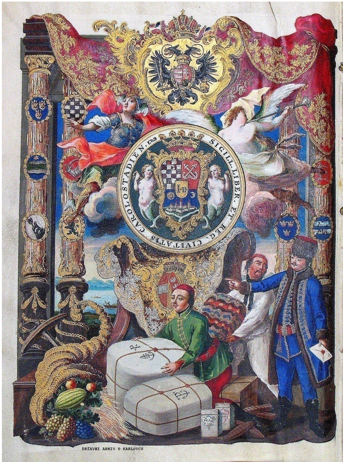
Slika br. 4

Povelja Josipa II. o proglašenju Karlovca sl. kr. gradom iz 1781. g. (prva stranica Povelje)