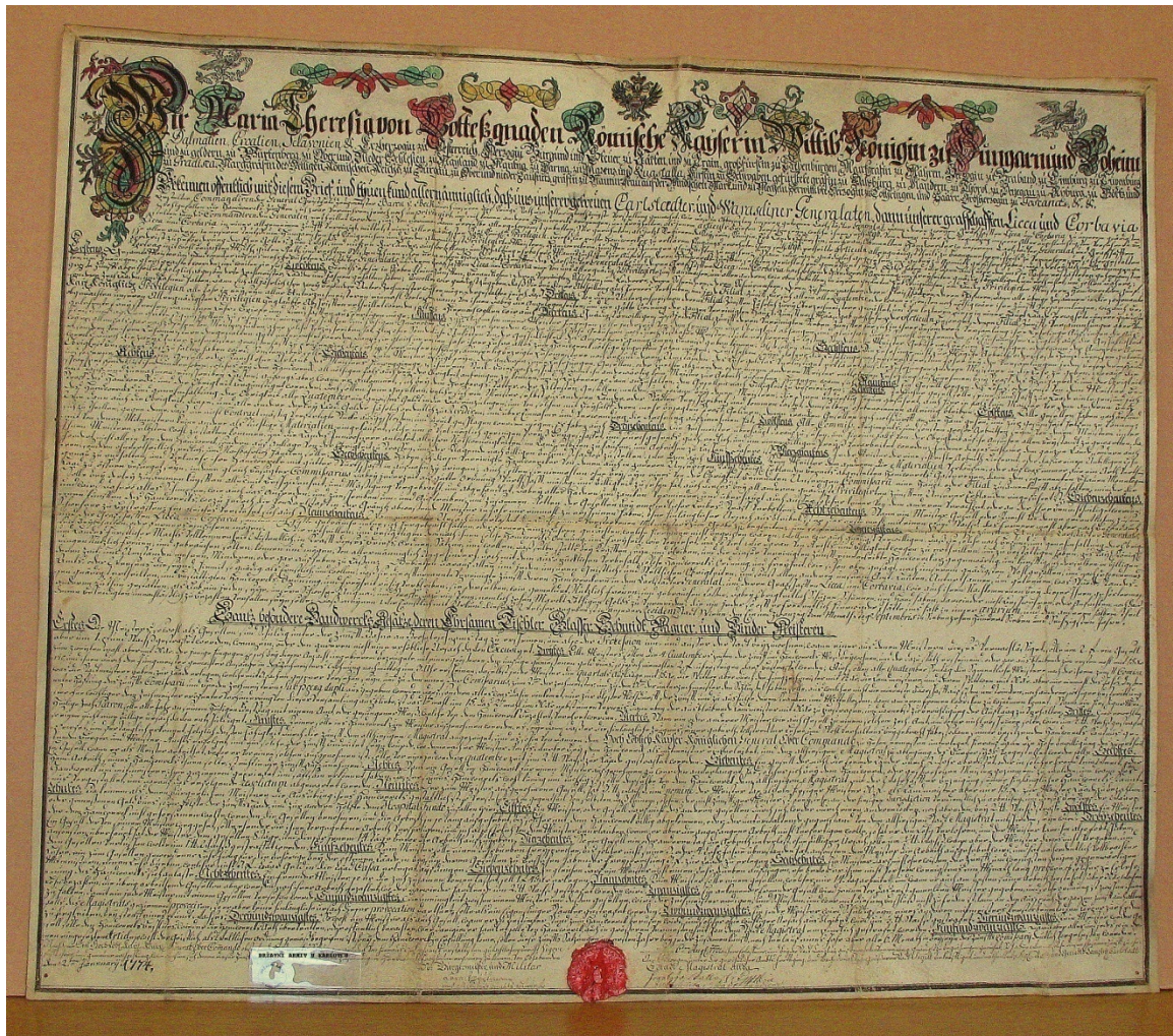
Slika br. 6.

Povelja Marije Terezije cehovima u Karlovačkom i Varaždinskom generalatu iz 1774 g.