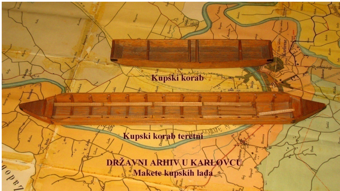
Slika br. 8.

Korabe – manje lađe za prijevoz robe Kupom od Siska do Karlovca DRŽAVNI ARHIV U KARLOVCU – MAKETE KUPSKIH LAĐA