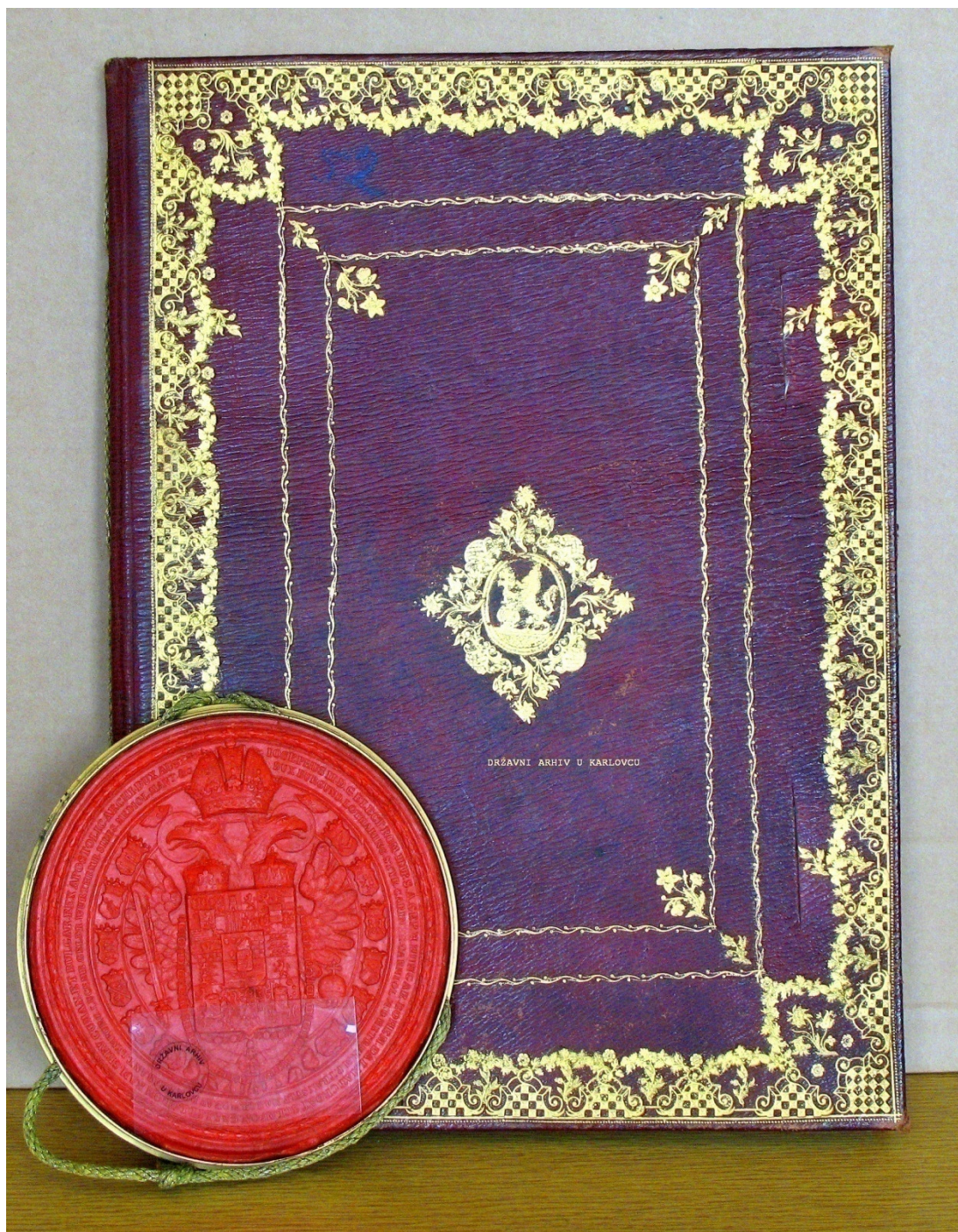
Slika br. 3

Povelja Josipa II. o proglašenju Karlovca sl. kr. gradom iz 1781. g. (naslovna strana Povelje) ZBIRKA: HR DAKA – 0137 ZBIRKA ISPRAVA (POVELJE), 1767 – 1878.