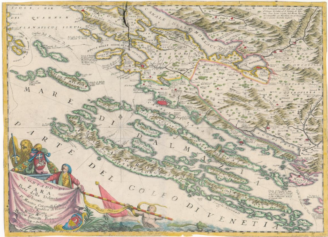
Karta 4. Vincenzo Maria Coronelli, Karta Jadranskog mora, XVI. st. (NSK)