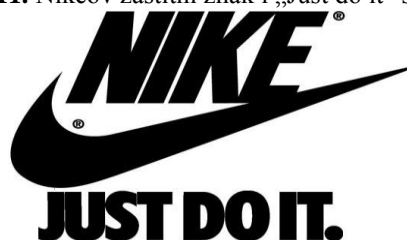
Slika 11. Nikeov zaštitni znak i „Just do it“ slogan 23

Nike ( slika 11 ) je od svog sveprisutnog zaštitnog znaka, simbola kvačice koji u većini svjetskih zemalja predstavlja oznaku za ispravnost i kvalitetu te ujedno predstavlja i krila grčke božice pobjede Nike , napravio jedan od najpoznatijih simbola marki na svijetu (Kotler i sur., 2006: 4; Tomić, 2008: 244). Snažnom simbolikom te raznim motivirajućim i inspirirajućim porukama Nike se pozicionira kao marka za sve ljude koji imaju dovoljno elana da je nose.