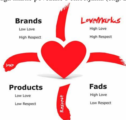
Slika 7. Snaga marke povezane s emocijama (eng. Lovemark ) 15