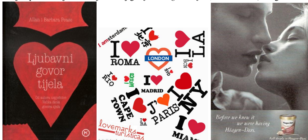
Slika 8. Primjeri povezivanja s emocijama: knjiga Ljubavni govor tijela , Lovemarks 16 , Häagen-Dazs sladoledi.

Ljubav je nešto što svi žele i što svi trebaju, ona predstavlja najjaču povezanost čovjeka s drugim živim bićem, stvari, mjestom ili događajem (Aristotel, 1989: 34, 55). S obzirom na to, ljubav je sama po sebi dobro, a svako dobro stvara ugodu (Aristotel, 1989: 55). Uгода vodi prema zadovoljstvu, a zadovoljstvo dovodi do ostvarenja sreće (Aristotel, 1989: 20, 26, 54-55). Emocija ljubavi ne može egzistirati ako nema povjerenja i sigurnosti u to da će se očekivanja i obećanja ostvariti (Hocenski-Dreiseidl, Papa, 2010: 486-488). Dakle, pouzdanost proizvoda, kao i povjerenje u proizvod, ovise o stimulaciji emocije ljubavi i osjećaja čežnje, žudnje i požude kojima se ujedno stimuliraju i sva ona područja mozga koja su uključena u sve važne odluke koje ljudi donose (Rappaport, 2013).