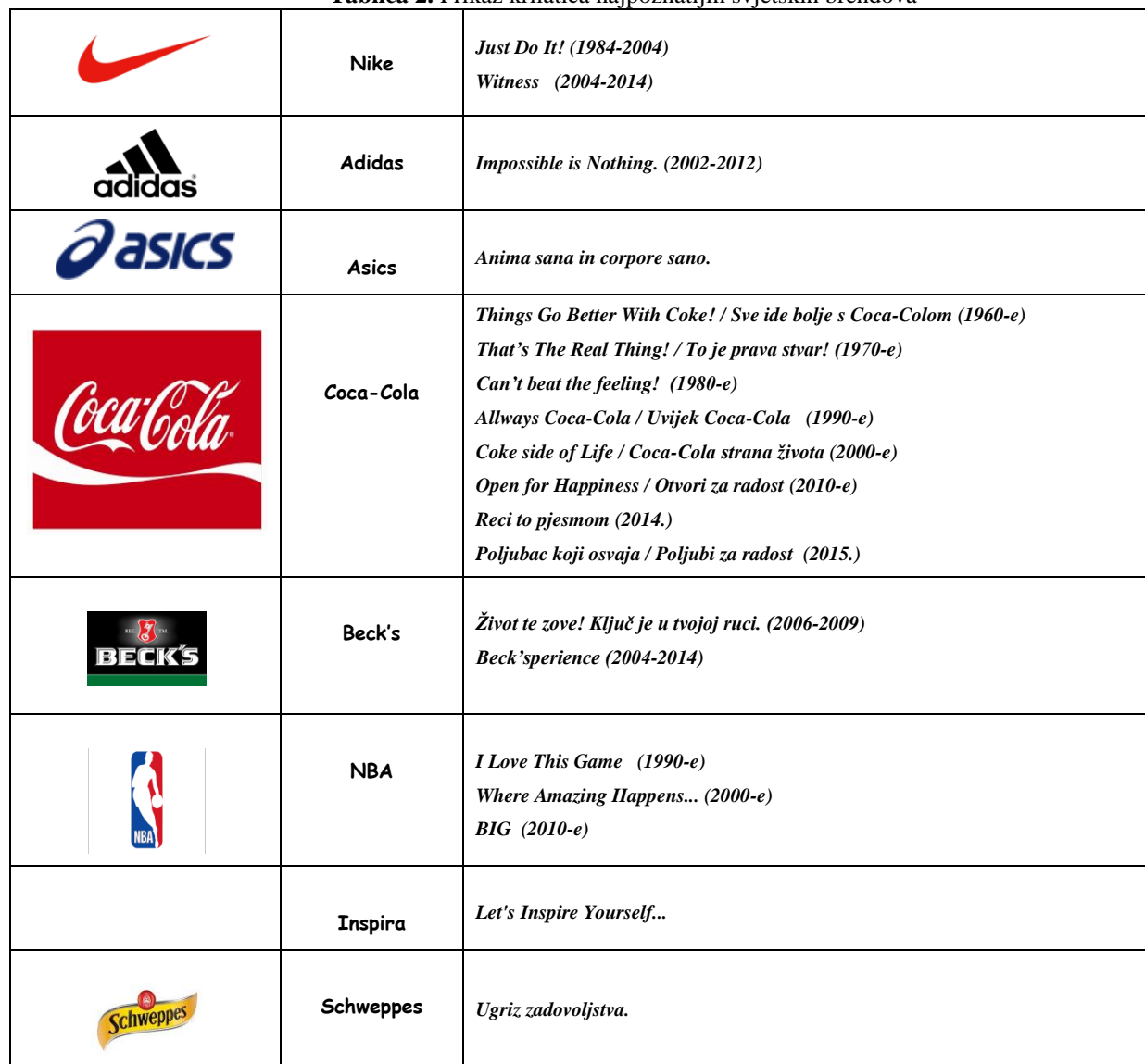
Tablica 2. Prikaz krilatica najpoznatijih svjetskih brendova

Prema Kotleru (2006: 73) učestalo ponavljanje slogana ima skoro hipnotičko djelovanje i time pomaže u stvaranju imidža marke. Pamtljiv slogan koji svi prepoznaju od neprocjenjive je važnosti za uspjeh i popularnost brenda (Kišiček, Stanković, 2014: 58; Kotler, 2006: 73). Slogan je pamtljivi moto, fraza ili krilatica koja, kratko i jasno, opisuje vrijednosti ili ideje za koje se brend zalaže, kao i svrhu samog proizvoda, a koristi se prilikom svake komunikacije brenda, odmah uz zaštitni znak (Ravlić, 2009b: 28). Slogan se često naziva moto ili krilatica zbog utjecaja koji ima na osobu koja ga čita. Kišiček i Stanković (2014: 58) kao primjer dobrog i lako pamtljivog slogana navode slogan hrvatske turističke zajednice iz 2009. godine koji glasi: „ Kad srce kaže ljeto, kaže Hrvatska “ – te ističu da o općoj prepoznatljivosti ove fraze govori njezino