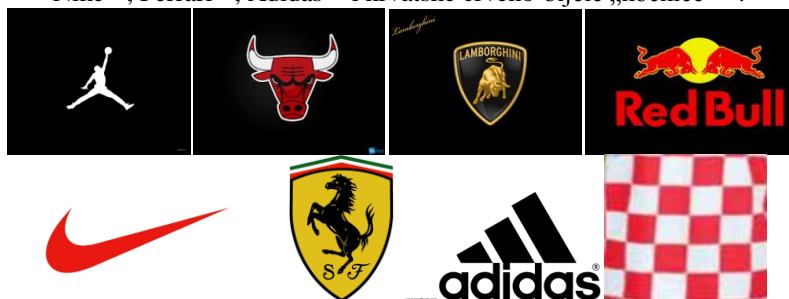
Slika 5. Primjeri zaštitnih znakova: Air Jordan 6 , Chicago Bulls 7 , Lamborghini 8 , Red Bull 9 , Nike 10 , Ferrari 11 , Adidas 12 i hrvatske crveno-bijele „kockice“ 13 .