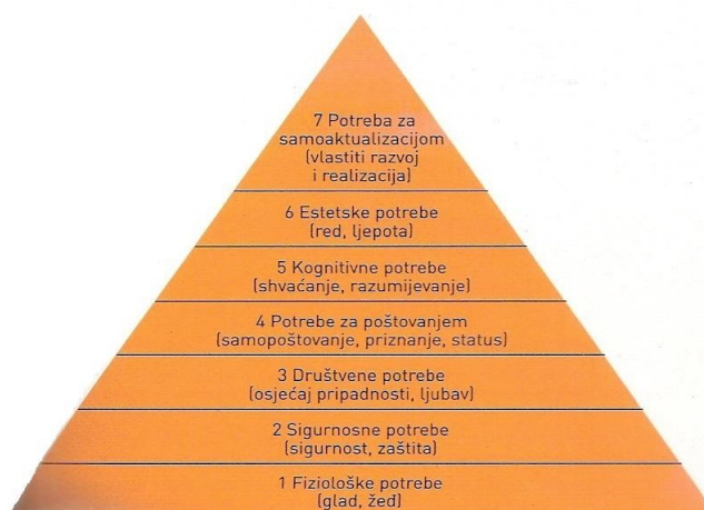
Slika 1. Hijerarhija potreba A. H. Maslowa (prema: Kotler i sur., 2006: 271)

Prema Martinu Lutheru Kingu Junioru za dobar i sretan život važna je kvaliteta života, a ne samo dugovječnost (prema Frajman-Ivković, 2012: 17). Ta misao opisuje centar interesa ekonomije sreće, prema kojoj kvaliteta života upućuje na stupanj u kojem ljudski život ima