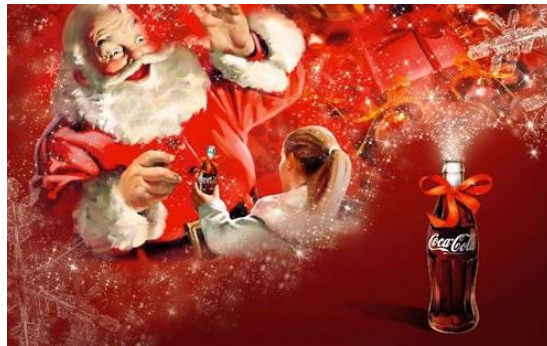
Slika 10. Božićna reklama Coca-Cole 22

Uz to, Coca-Cola, za stvaranje takvih pozitivnih asocijacija koristi i upečatljive zaštitne boje, crvenu i bijelu, a to su boje koje tradicionalno najviše asociiraju na Božić. Crvena boja se oduvijek povezivala i povezuje se s ljubavi i strašću (Petrović, 1986: 111; Graham, 1998: 10, 12, 14, 16-17) dok je bijela boja simbol dobra, čistoće, vrline i čednosti (Petrović, 1986: 132), a također je i Djed Božićnjak u crveno-bijelom odijelu. Osim povezivanja s Božićem i blagdanskom čarolijom, Coca-Cola u svojoj marketinškoj persuaziji koristi i druge asocijacije poput zabave i zadovoljstva u ljetnom dijelu godine te doživljaja prijateljstva i obiteljskih druženja u proljeće.