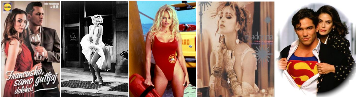
Slika 9. Primjeri zavodjenja u marketingu: Lidlov katalog vina 17 , Marilyn Monroe 18 , TV serija Baywatch 19 , album „Like a virgin“ 20 , TV serija „Superman“ 21 .

Kadar lijepog ljudskog lica ima izrazito upečatljiv učinak na stanje ljudske svijesti jer od (lijepe) ljudske slike, ljudi se mogu doslovno izbezumiti kao od ljubavnog napitka (Barthes, 2009: 54). Persuazivni efekt draženja i zavodjenja predstavlja vrlo učinkovit način persuazije u marketinškim komunikacijama i stoga je njegova primjena vrlo česta i raširena. Takav tip marketinških poruka vrlo je sugestivan, stoga apel na seks i seksualnost putem lijepih i privlačnih modela vrlo često ima zavodljiv učinak te navodi ljude da barem razmišljaju i raspravljaju o reklami.