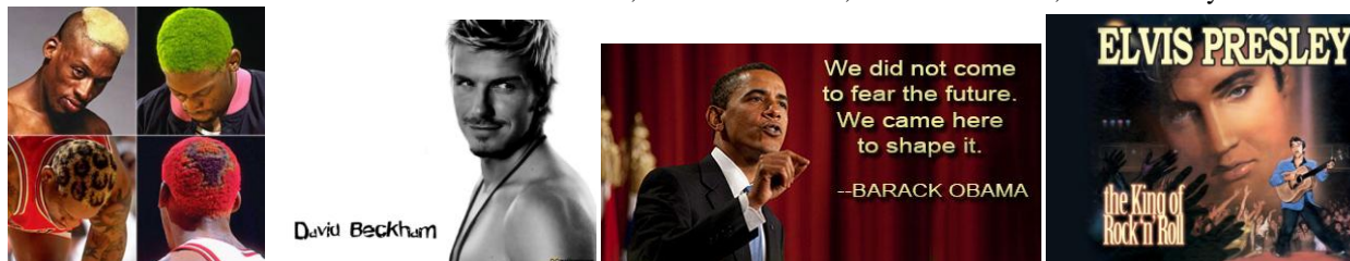
Slika 4. Osobe brendovi: Dennis Rodman 2 , David Beckham 3 , Barack Obama 4 , Elvis Presley 5

S obzirom na sve veću ponudu raznih proizvoda i usluga, ljudi su sve izbirljiviji pa na njihove odluke utječu i najsitnije pojedinosti (Skoko, 2006: 52). Važan postaje subjektivni doživljaj koji