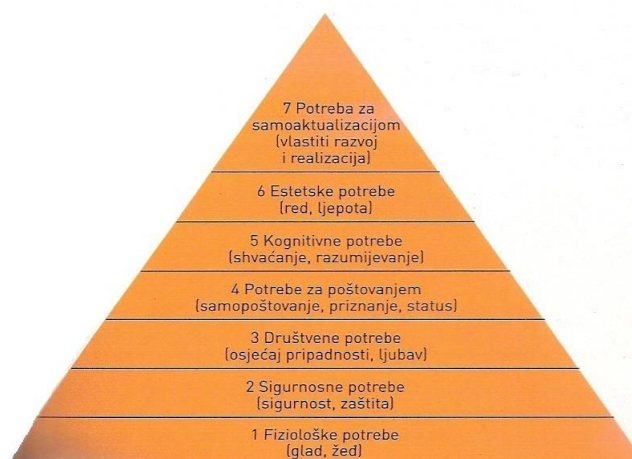
Slika 1. Hijerarhija potreba A. H. Maslowa (prema: Kotler i sur., 2006: 271)

Prema Martinu Lutheru Kingu Junioru za dobar i sretan život važna je kvaliteta života, a ne samo dugovječnost (prema Frajman-Ivković, 2012: 17). Ta misao opisuje centar interesa ekonomije sreće, prema kojoj kvaliteta života upućuje na stupanj u kojem ljudski život ima