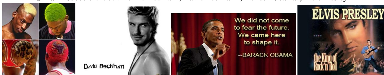
Slika 4. Osobe brendovi: Dennis Rodman 2 , David Beckham 3 , Barack Obama 4 , Elvis Presley 5

S obzirom na sve veću ponudu raznih proizvoda i usluga, ljudi su sve izbirljiviji pa na njihove odluke utječu i najsitnije pojedinosti (Skoko, 2006: 52). Važan postaje subjektivni doživljaj koji