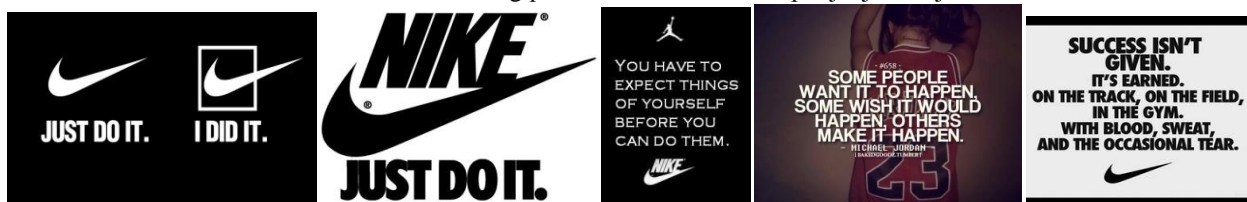
Slika 6. Nikeov marketing povezan s odlučnosti i ispunjenjem ciljeva 14 .

S druge strane, karakteristike svećanih govora su naglašavanje zajedničkih uvjerenja, vrijednosti, stavova i interesa (Malinowski, 1946 prema Kišiček, Stanković, 2014: 99), stvaranje