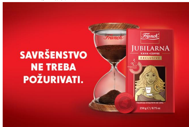
Slika 3. Reklama za Franck kavu 1

Pobuđivanje želje za savršenstvom može se odnositi i na san o savršenstvu poput savršenog odmora i uživanja. Najbolji primjer za navedeno je reklama za „Raffaello“ koja se prikazuje tijekom ljeta, a čiji slogan glasi: „Savršen užitak“ dok kroz reklamu prolaze ove riječi: „Za savršeni trenutak, potrebni su: vrijeme, harmonija, posvećenost i opuštenost“ i sve to popraćeno je blagim notama i predivnim slikama mora, plaža i uživanja. Pozivanje na savršenstvo postalo je nezaobilazni dio repertoara i u marketinškoj persuaziji Ledo sladoleda pa se tako na početku reklame za sladoled Ledo King postavlja pitanje: „Jeste li se ikada zapitali kako se radi King – savršeni sladoled“ [vidi: https://www.youtube.com/watch?v=ru960hLeH_o ] dok reklama za Ledo Grandissimo započinje riječima: „Na putu do onog savršenog, puno istražujemo, biramo, isprobavamo ...“ [vidi: https://www.youtube.com/watch?v=-295qSmNUGk ]. Slično vrijedi i za novi slogan Franck jubilarne kave (slika 3) koji glasi: „Savršenstvo ne treba požurivati“ i u čijoj reklami vidimo koje sve sretne i radosne trenutke proživljavamo svako jutro ispijajući Franck jubilarnu kavu [vidi: https://www.youtube.com/watch?v=QuHgc2nLVAc ].