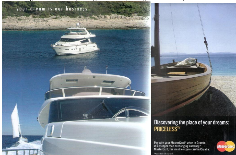
Slika 2. Marketing snova: Yaretti (Sailing in Croatia, 2006), MasterCard (Hrvatske Autoceste, 2015)