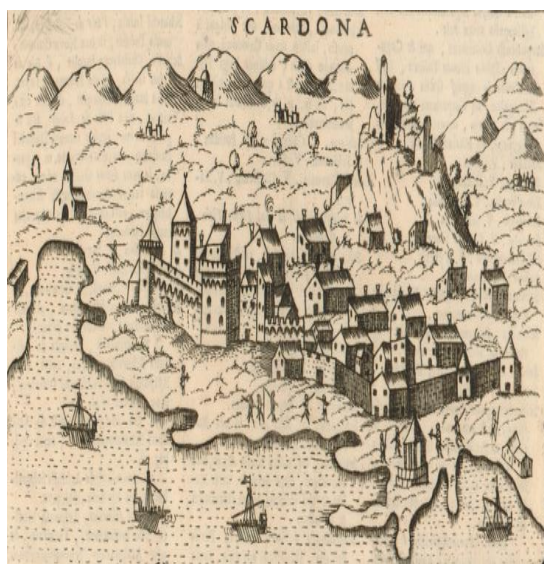
FOTOGRAFIJA 2: Skradin u 18. st. 142