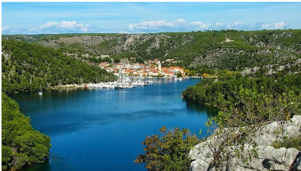
FOTOGRAFIJA 1: Skradin danas .