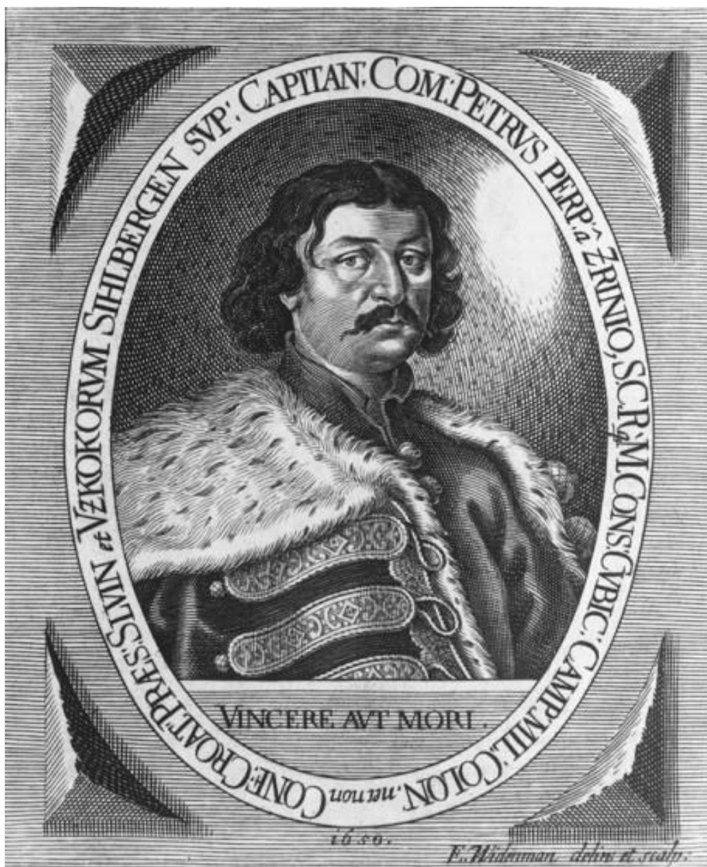
Slika 5: Petar Zrinski