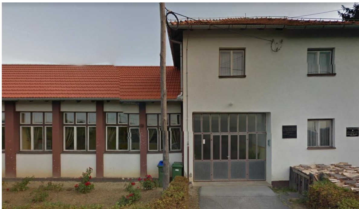
Slika 6: Osnovna škola Jurja Kamenara

Od ostalih članova obitelji, Benković-Marković (Isto: 13) kao istaknutijega spominje Nikolu Kamenara, svećenika koji je završio bogoslovne nauke u zagrebačkom sjemeništu, no pošto je bio premlad, primio je samo subđakonat. U skladu s donedavnim u Hrvatskoj vrlo patrijarhalnim poimanjem života, o ženskoj djeci autorica nije pronašla mnogo podataka.