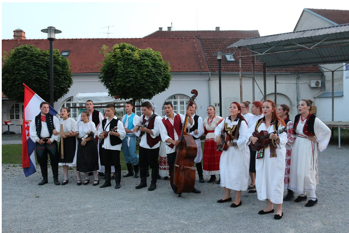
Slika 9: Gradišćanski Hrvati

U pjesmama iz zbirke možemo naći podudarnosti s gradišćanskohrvatskim idiomima na svim jezičnim razinama. Sanja Benković-Marković (Isto) izdvojila je oblike imenica i glagola. Navodi da niječni prezent glagola biti u gradišćanskohrvatskim idiomima glasi: ja nisam, ti nisi, on ni, ona ni, ono ni, mi nismo, vi niste, oni nisu, one nisu, ona nisu . Tako je i u razmatranoj zbirci: ni poglavara, ni gospodara, ni ji para, ni mogel . Gradišćanski Hrvati imaju starohrvatsku kratku množinu muškoga roda jednosložnih imenica koju pronalazimo i kod Kamenara (muž - muži , miš - miši ), zatim stari genitiv množine imenica ženskoga roda s nultim morfemom ( grab, bab, mačak, vur ), dativ množine ženskoga roda s nastavkom -am ( čelam ), te genitiv množine muškoga roda s nastavkom -ov ( više vragov, danov, sedam sirov, mačkov ) (Isto: 398).