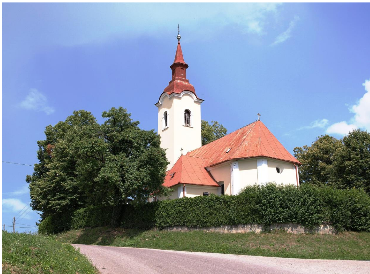
Slika 1. Župna crkva Sv. Kuzme i Damjana u Vrhovcu