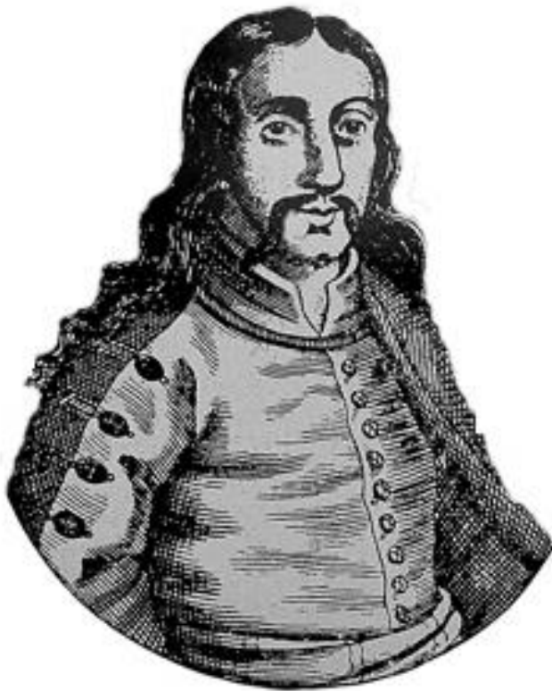
Slika 4: Fran Krsto Frankopan