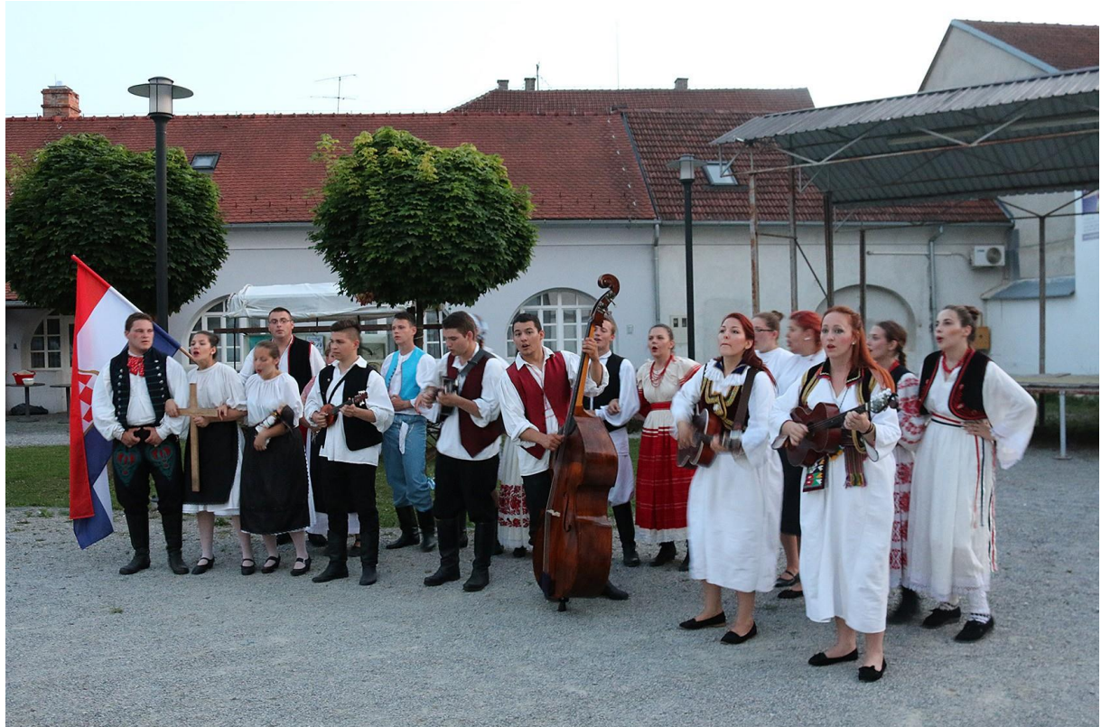
Slika 9: Gradišćanski Hrvati