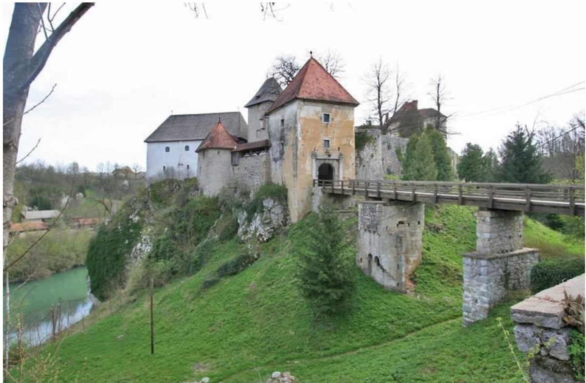
Slika 3: Stari grad Ozalj

(Isto: 206) vjenčanje Ane Katarine Frankopan i Petra Zrinskoga, gotovo stotinu godina poslije, tj. 27. listopada 1641. godine. Tada su se gradu našli važni zastupnici vladara mletačke republike, mnoštvo plemića, ali i običnih građana. Zajedničko vlasništvo trajalo je do 1649. godine kada su braća Nikola i Petar odlučili među sobom podijeliti posjede. Petar je dobio Ozalj, gdje je nastavio boraviti sa svojom suprugom Katarinom (Isto: 207). Vjeruje se kako je u samom Ozlju Petar na hrvatski preveo Adrianskoga mora sirenu , spjev koji je izvorno na mađarskom jeziku napisao njegov brat Nikola. U tom je gradu banica Katarina sastavila Putni Tovaruš . Za vrijeme Zrinsko-Frankopanske bune, pa i same urote, Ozalj je bio sjedište svih djelovanja u obrani protiv Turaka, sve dok sama urota nije bila provedena. Tada je vrlo brzo, po nalogu kralja Leopolda I. već 1670. godine, karlovački general Herberstein zaposjeo grad i okolne teritorije. Većina je posjeda opljačkana, a sve su vrijednosti zaplijenjene i prevezene u Karlovac (Isto: 208).