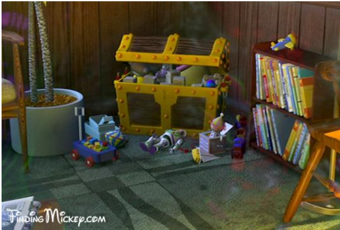
Slika 6. Buzz Svjetlosni iz trilogije Priča o igračkama u crtanom filmu Potraga za Nemom